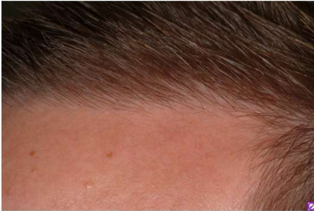
Extreme close up with short haircut Post-Op 2 years

Subject: Re: Ergebnis Dr. Keser 1500 Grafts FUE 12 Monate Post-OP Posted by floater on Sat, 20 Sep 2008 18:25:32 GMT