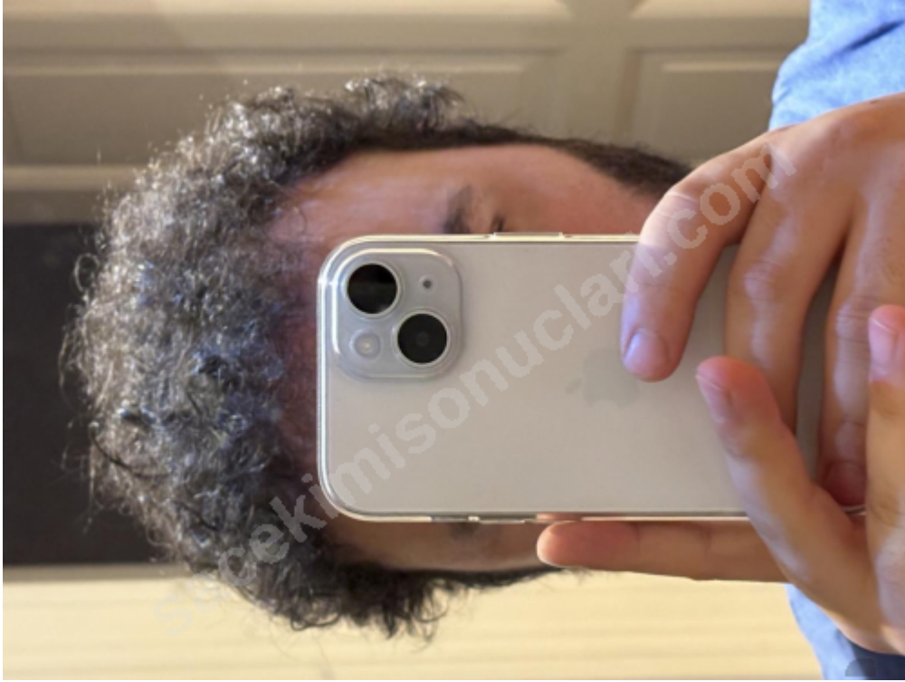
2) IMG_0556.png , downloaded 41 times