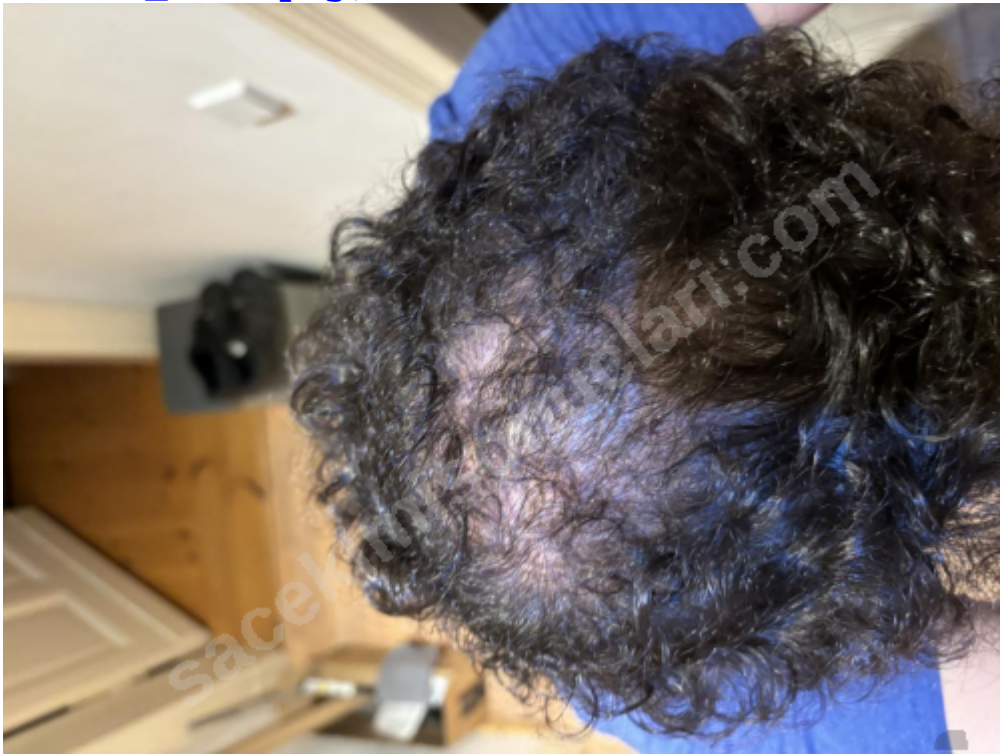
3) IMG_0557.png , downloaded 35 times