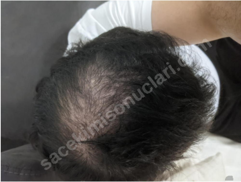
3) IMG_0547.png , downloaded 29 times