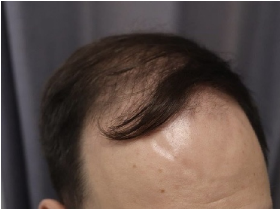
2) IMG_8471.jpeg , downloaded 358 times