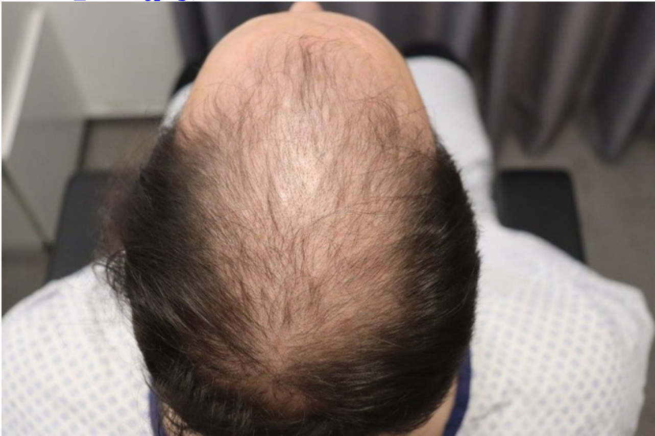
5) IMG_8465.jpeg , downloaded 311 times