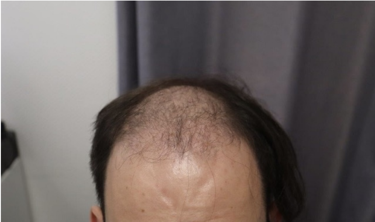
4) IMG_8469.jpeg , downloaded 286 times