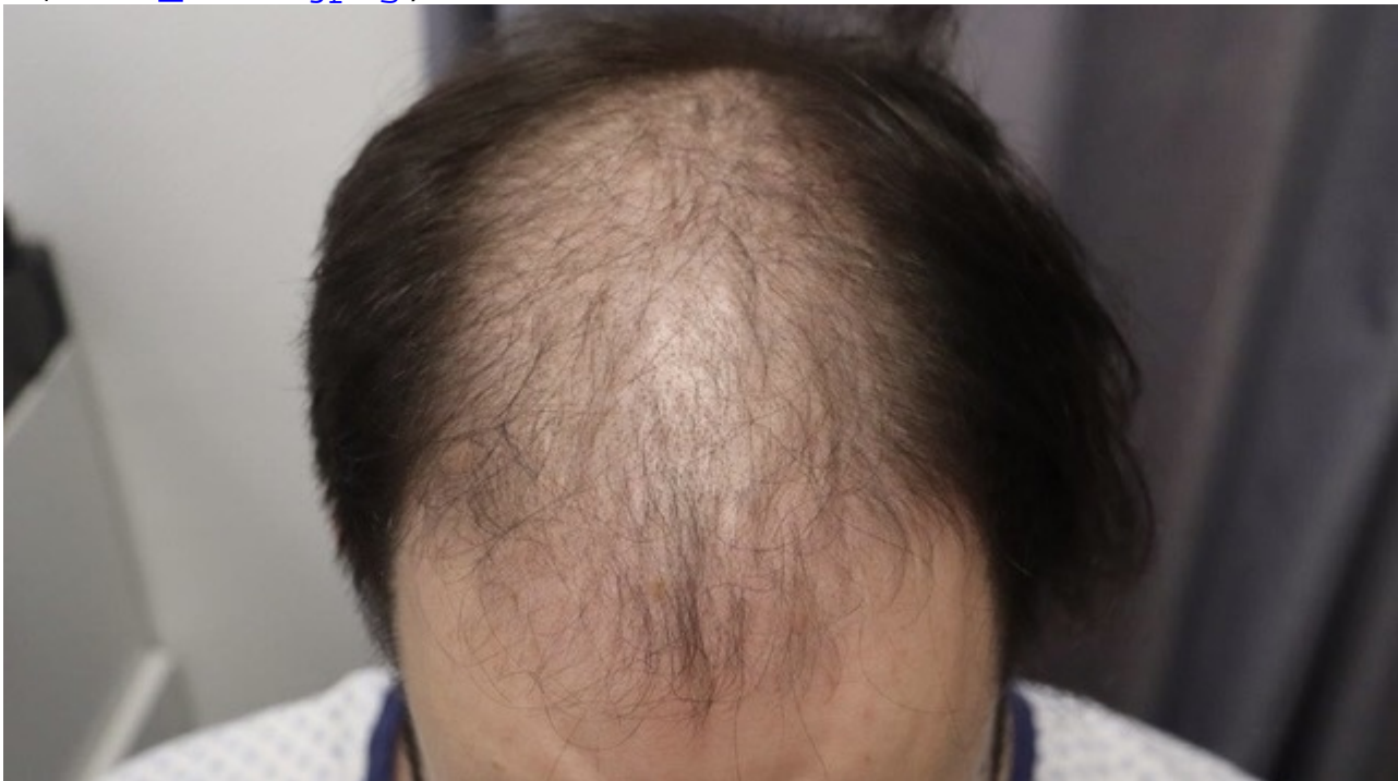
3) IMG_8470.jpeg , downloaded 301 times