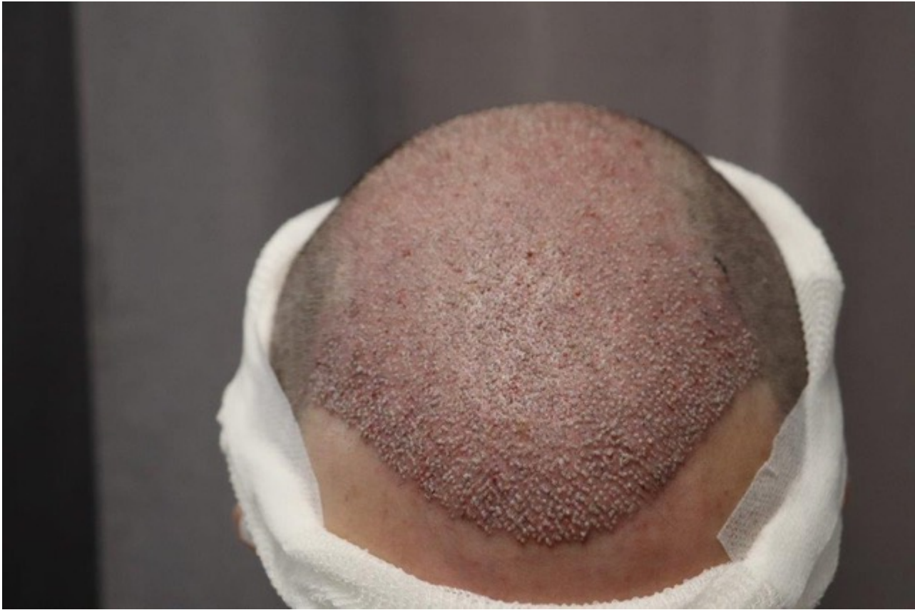
3) IMG_8466.jpeg , downloaded 257 times