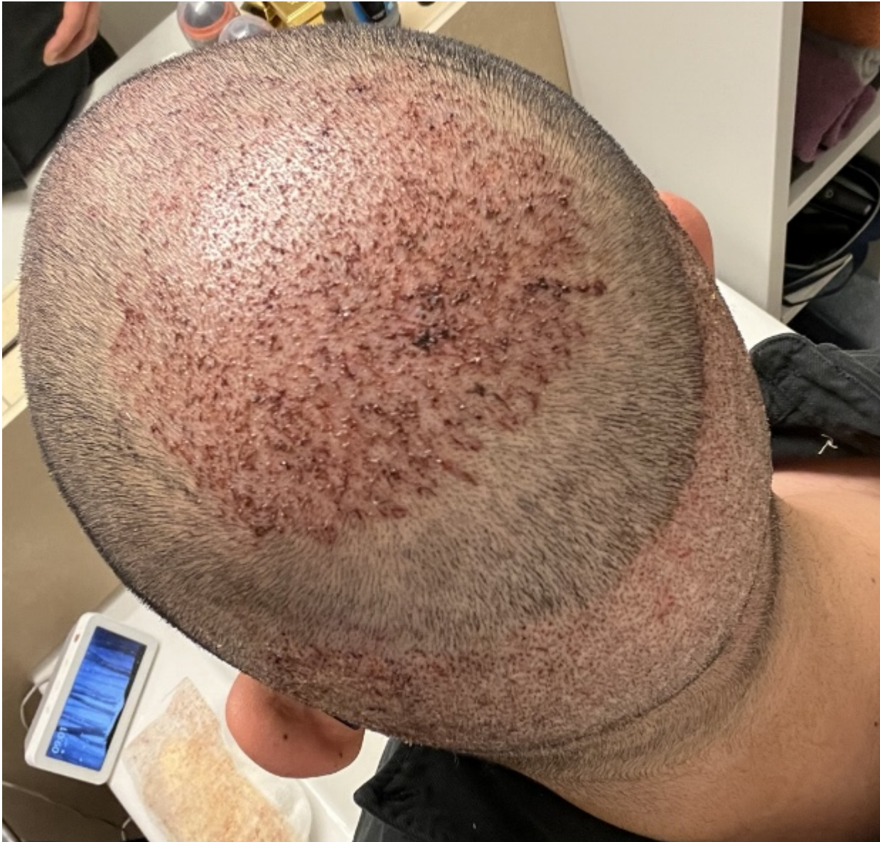
2) IMG_2014.jpg , downloaded 280 times