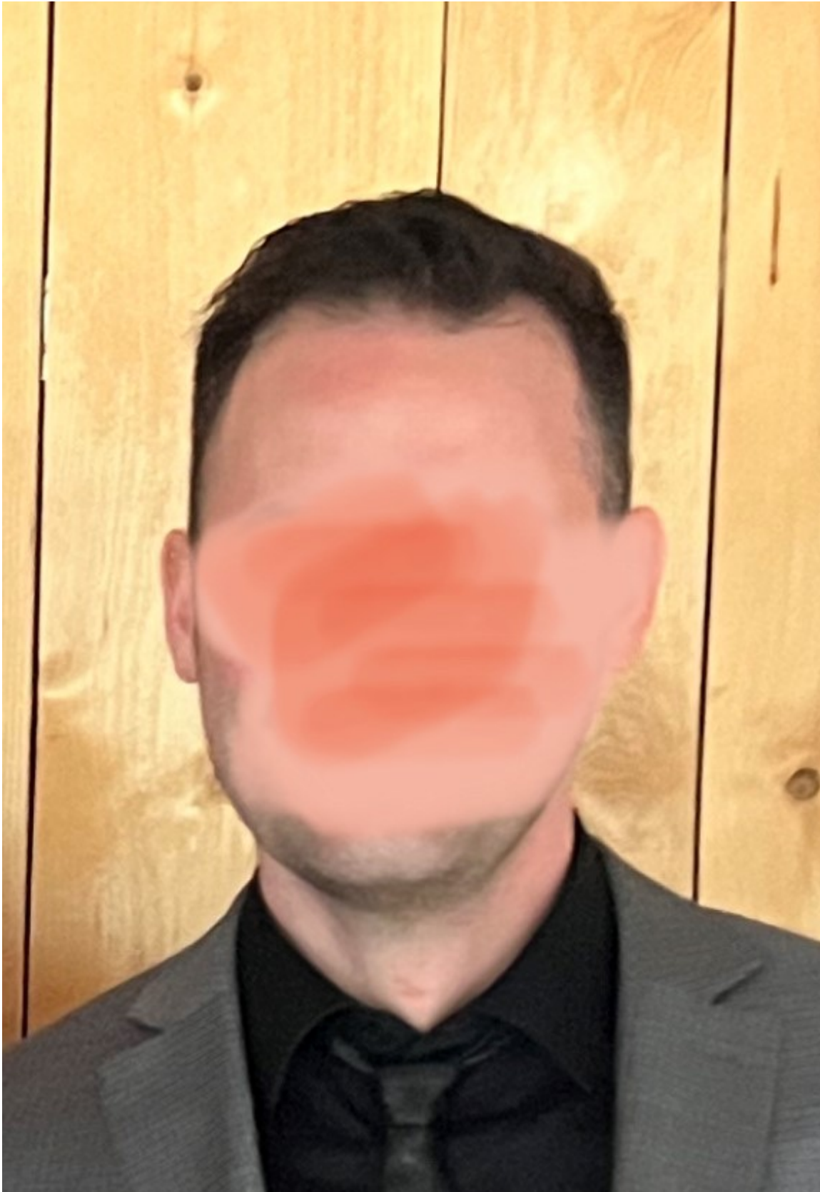
4) Vorher2.jpg , downloaded 817 times