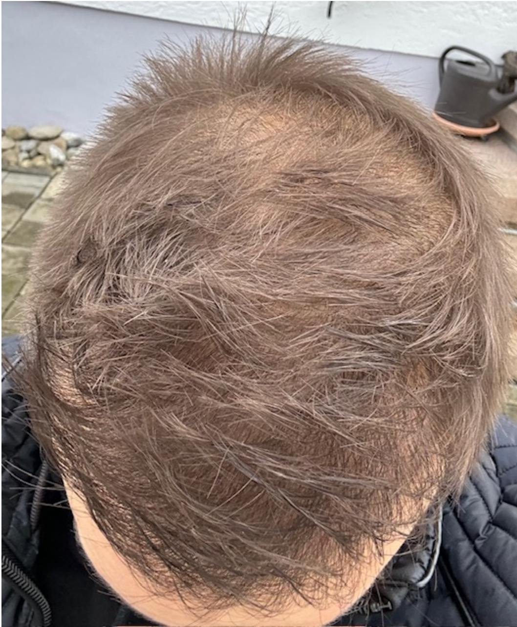
4) IMG_8731.jpeg , downloaded 263 times