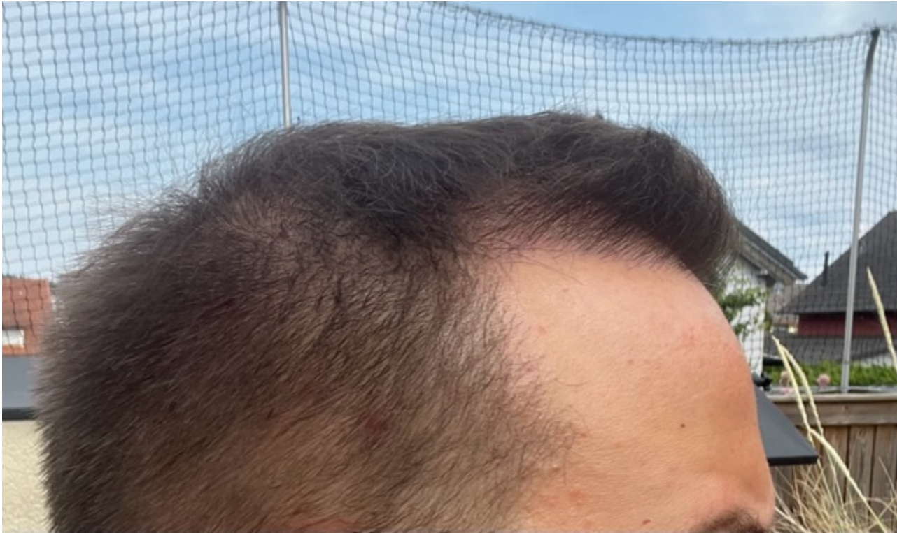
3) IMG_7118.jpeg , downloaded 561 times