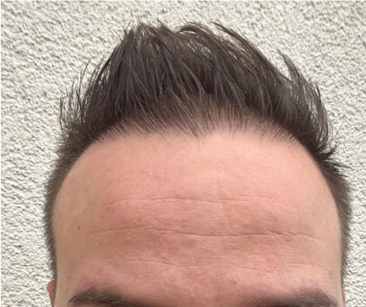
2) IMG_8421.jpeg , downloaded 345 times