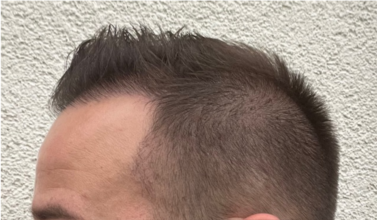
4) IMG_8423.jpeg , downloaded 322 times