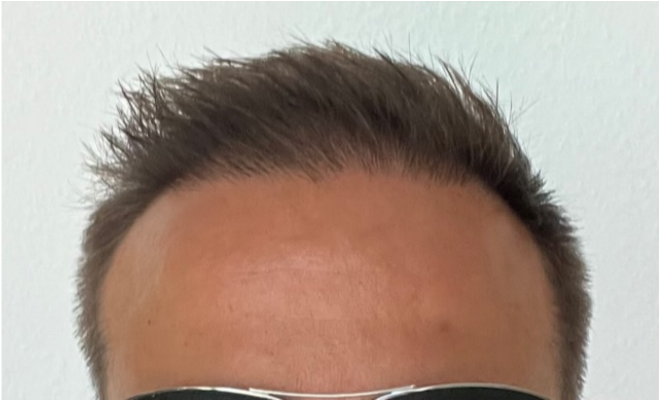
2) IMG_7655.jpeg , downloaded 483 times