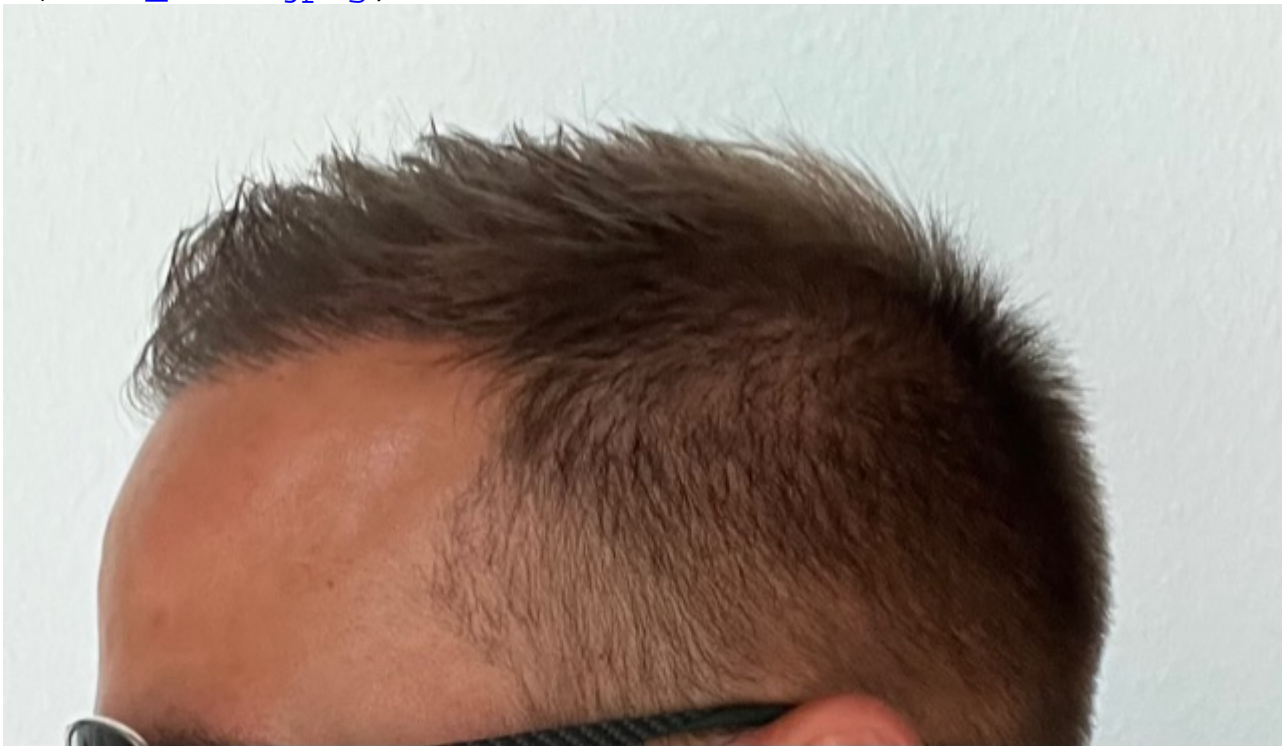
3) IMG_7656.jpeg , downloaded 481 times