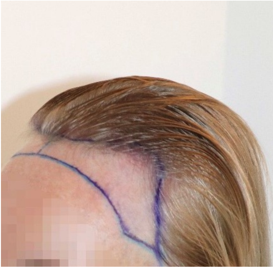
3) Einzeichnung_rechts_vor_OP.JPEG , downloaded 1240 times