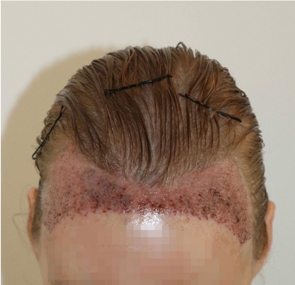
5) nach 1. Haarwäsche_links.JPEG , downloaded 443 times