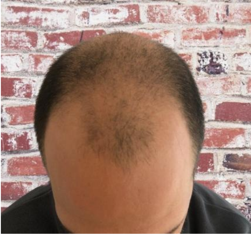
2) bild2.jpeg , downloaded 339 times