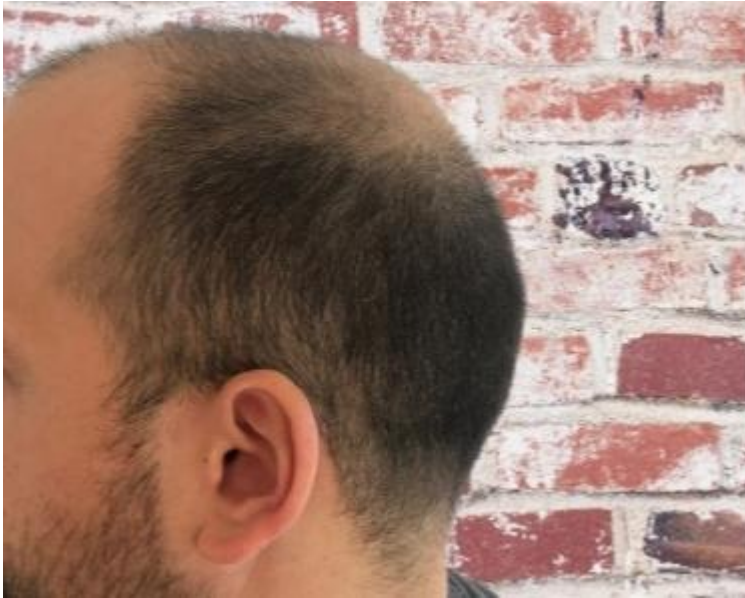
3) bild3.jpeg , downloaded 355 times