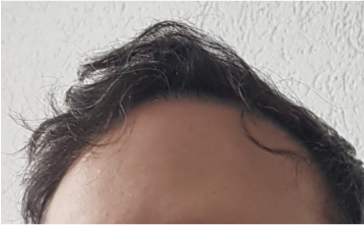
2) Polish_20230203_192502818.jpg , downloaded 576 times