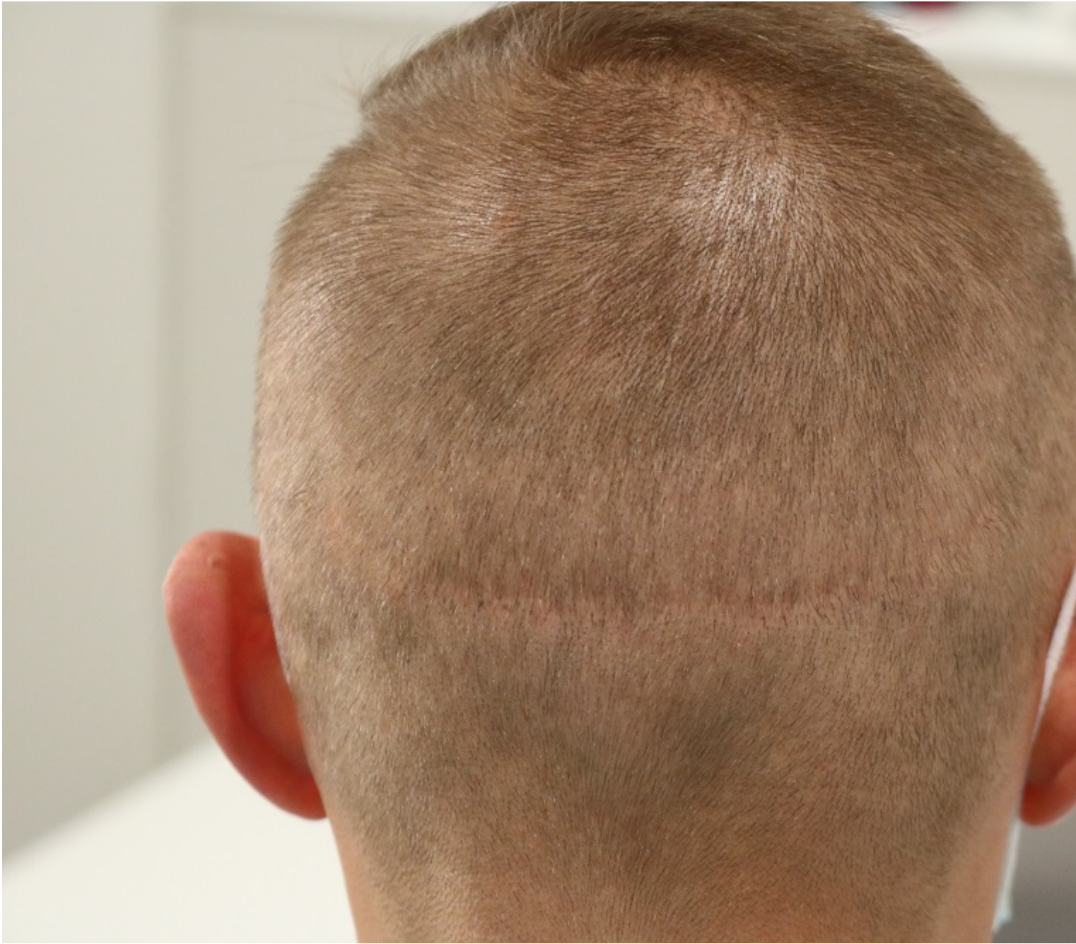
4) IMG_1769 - kopie.JPG , downloaded 539 times