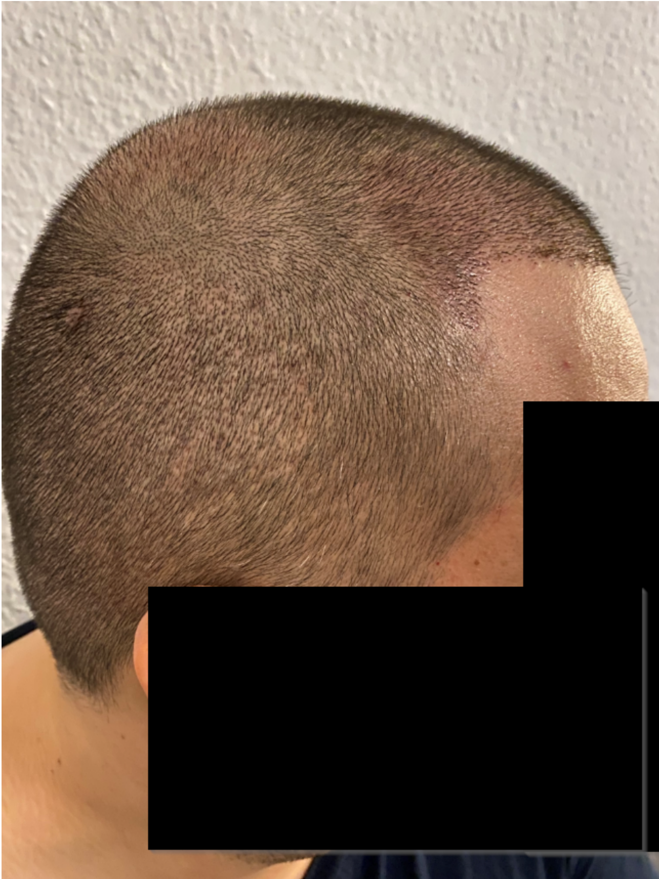
5) 7 Tage postOP_Tonsur.png , downloaded 342 times