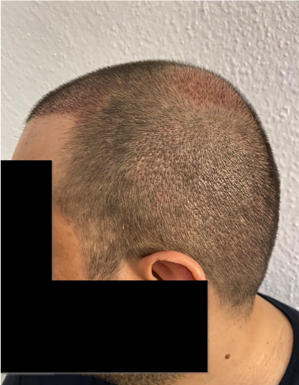
4) 7 Tage postOP_rechts.png , downloaded 271 times