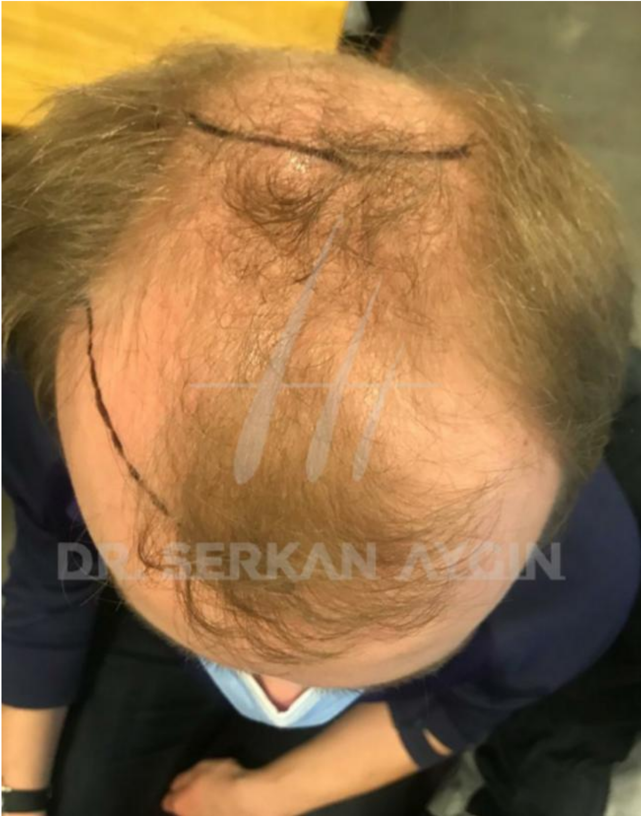
3) Tag der OP_Direkt vor OP und Rasur.jpeg, downloaded 703 times