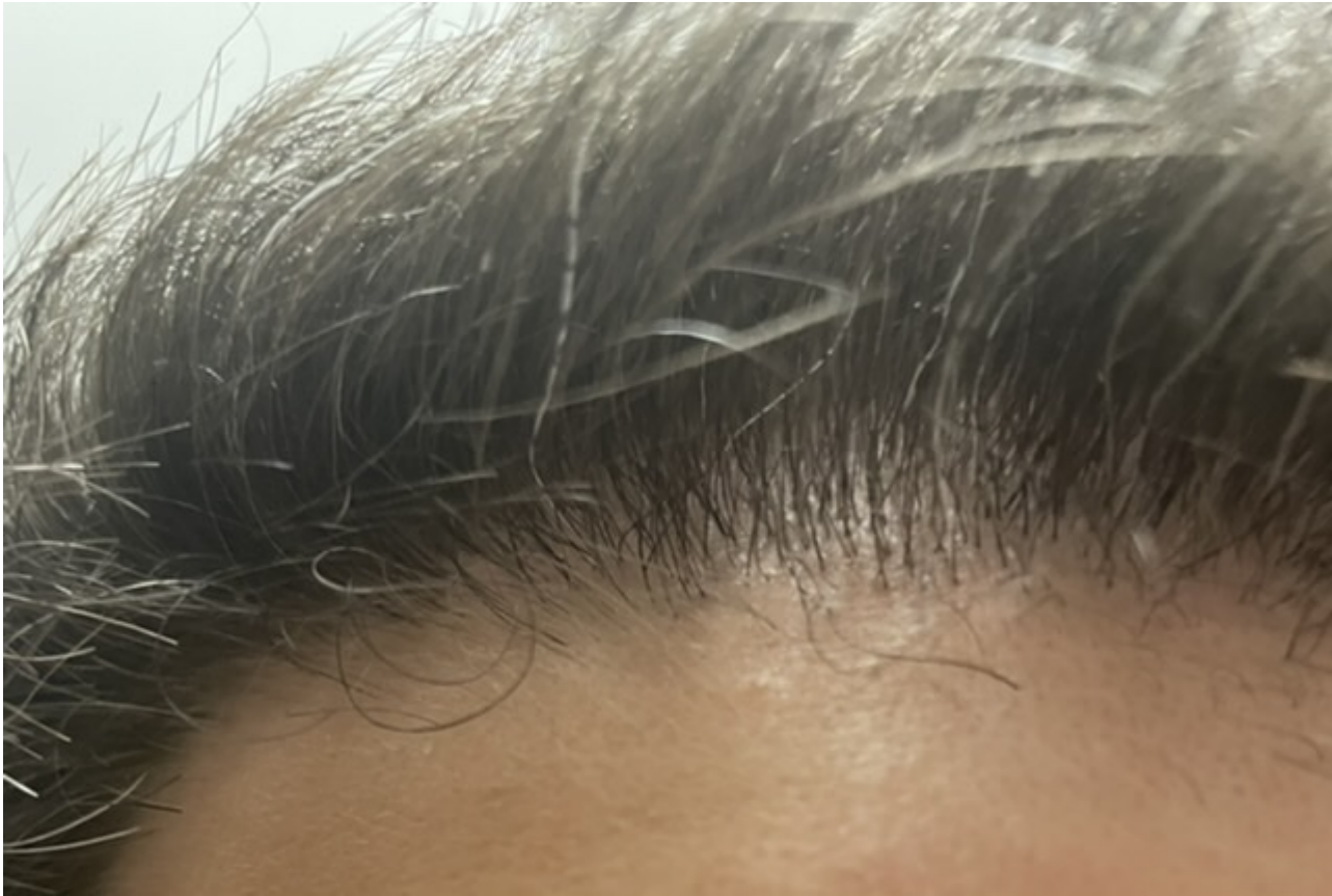
2) 22004BCE-3514-4171-9555-31C776EE8F7F.jpeg , downloaded 737 times