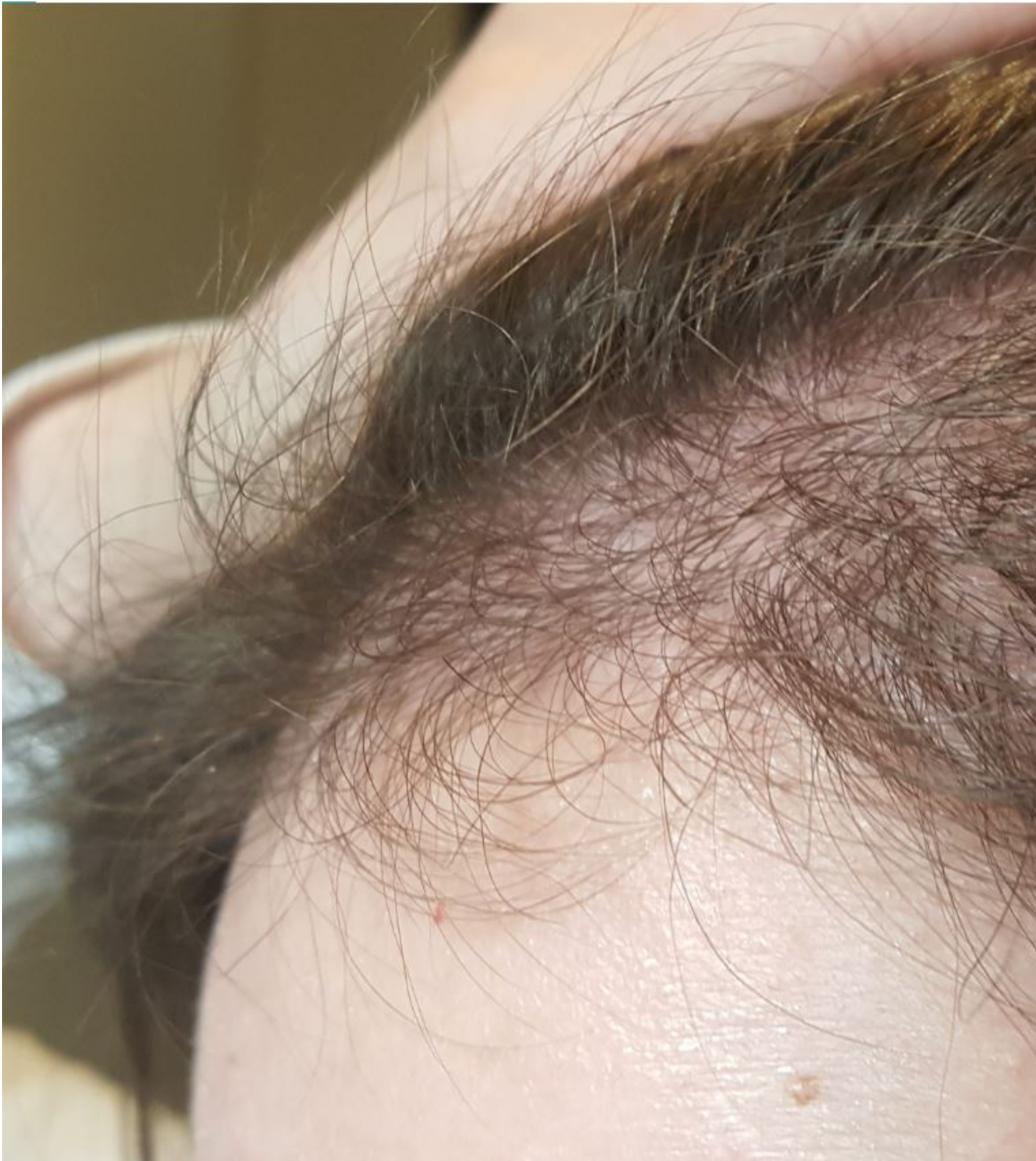
4) 6 Monate rechts (2).jpg , downloaded 2284 times