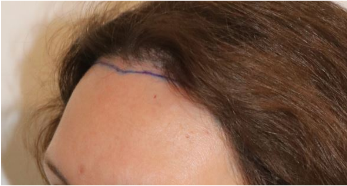
3) Touch up links.JPG , downloaded 1692 times