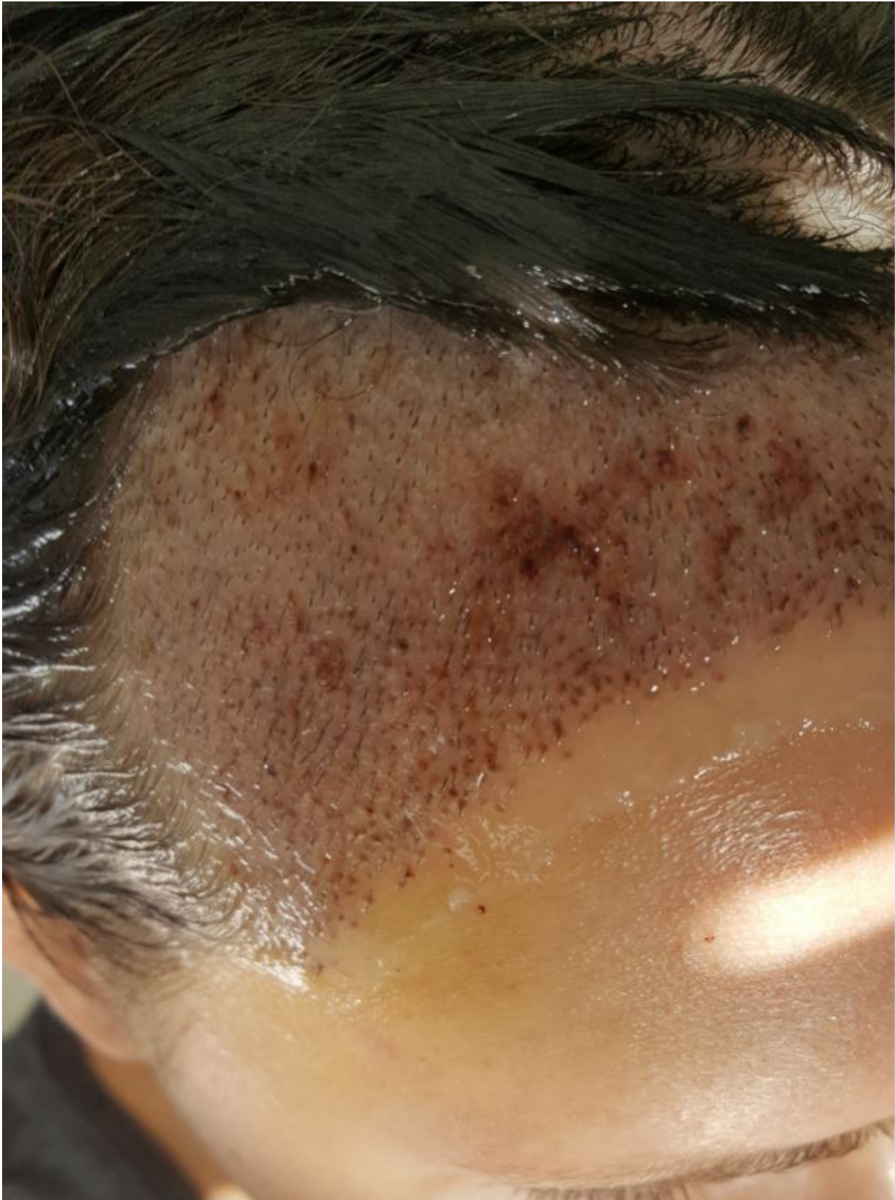
2) Capture2.JPG , downloaded 3329 times