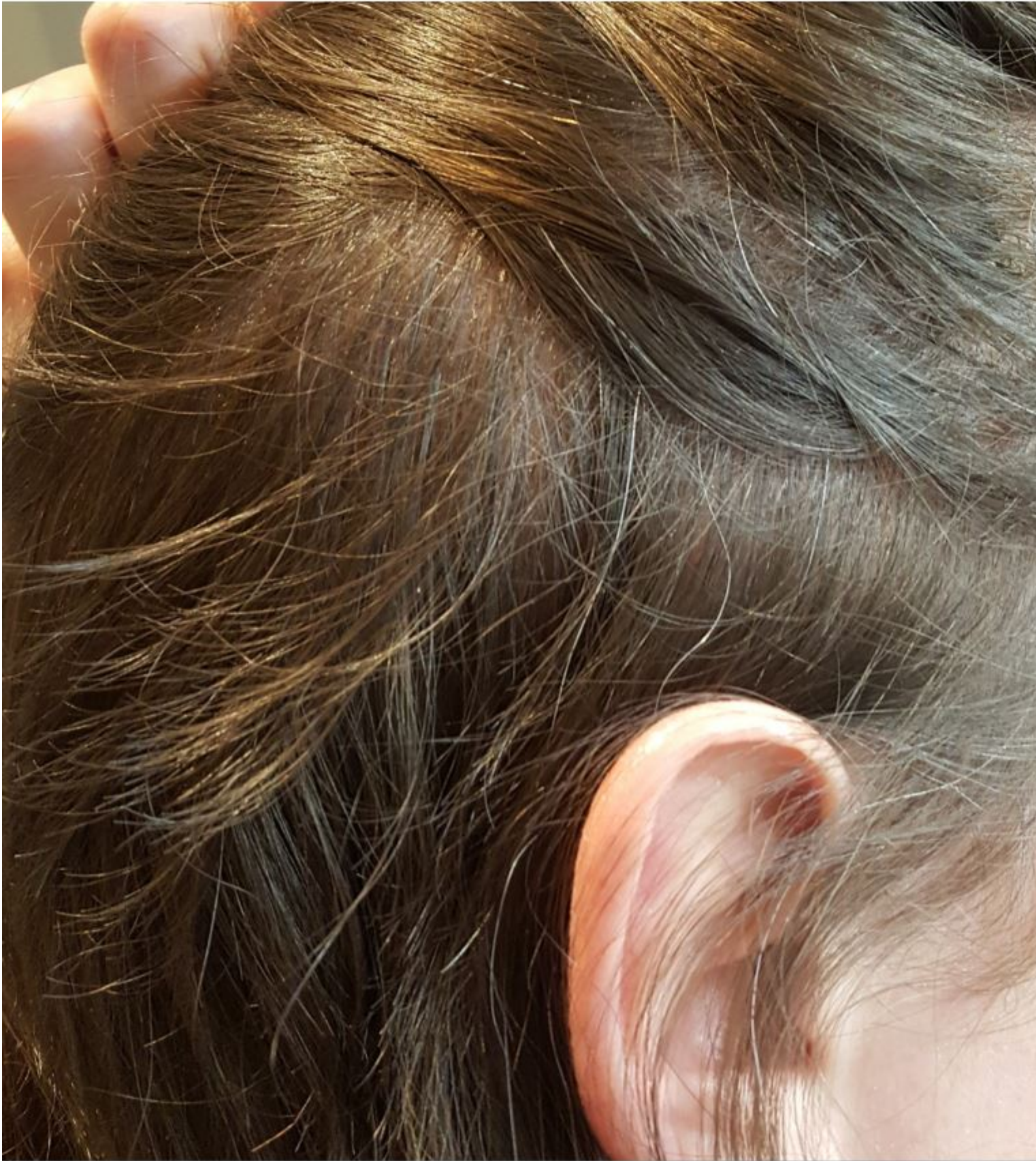
3) 5 Monate vorne (2).jpg , downloaded 2558 times