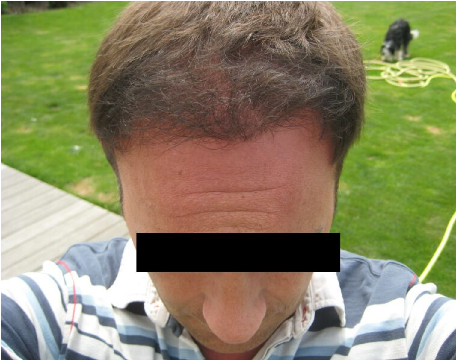
2) 10 Monat II Front5.jpg , downloaded 319 times