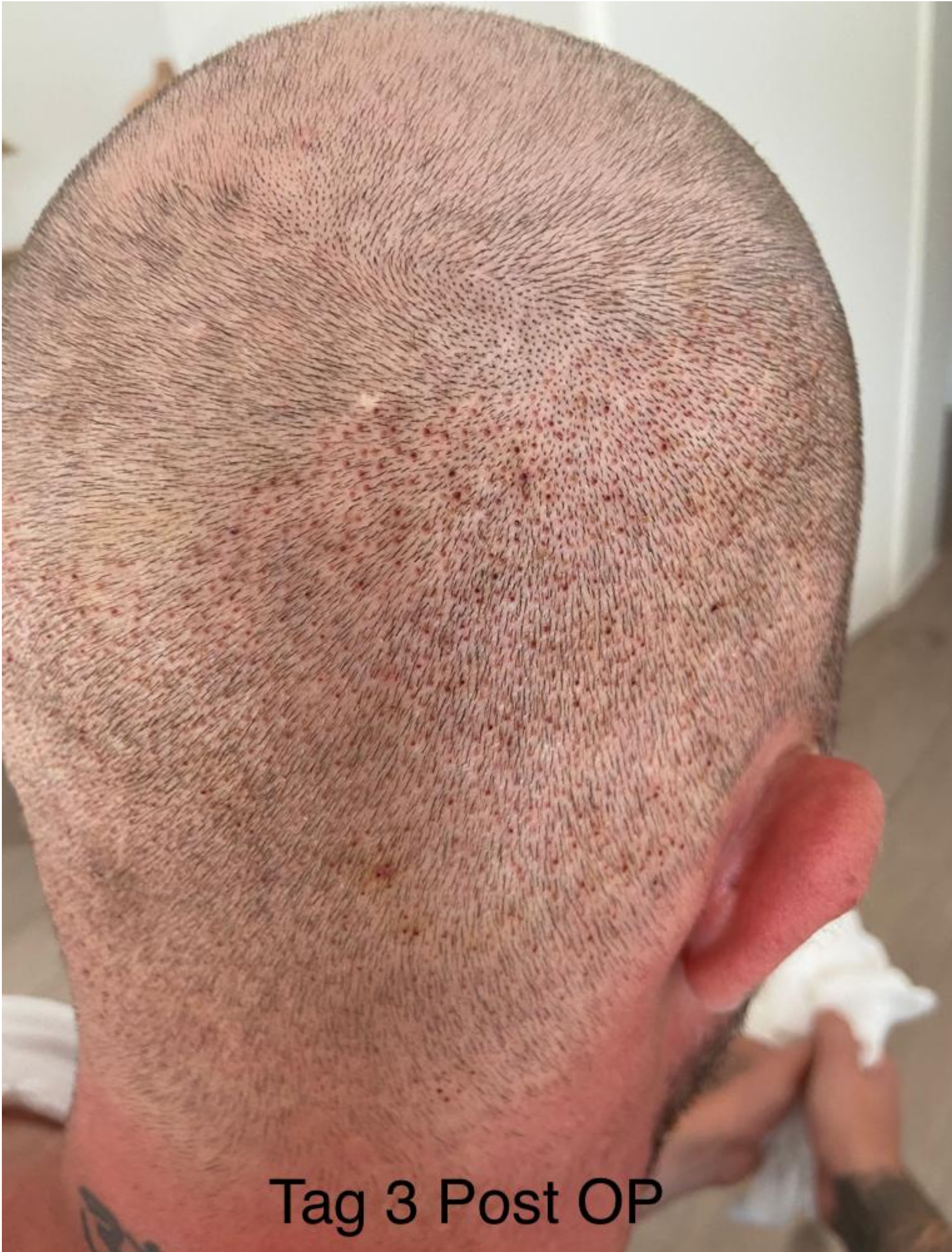
Tag 3 Post OP