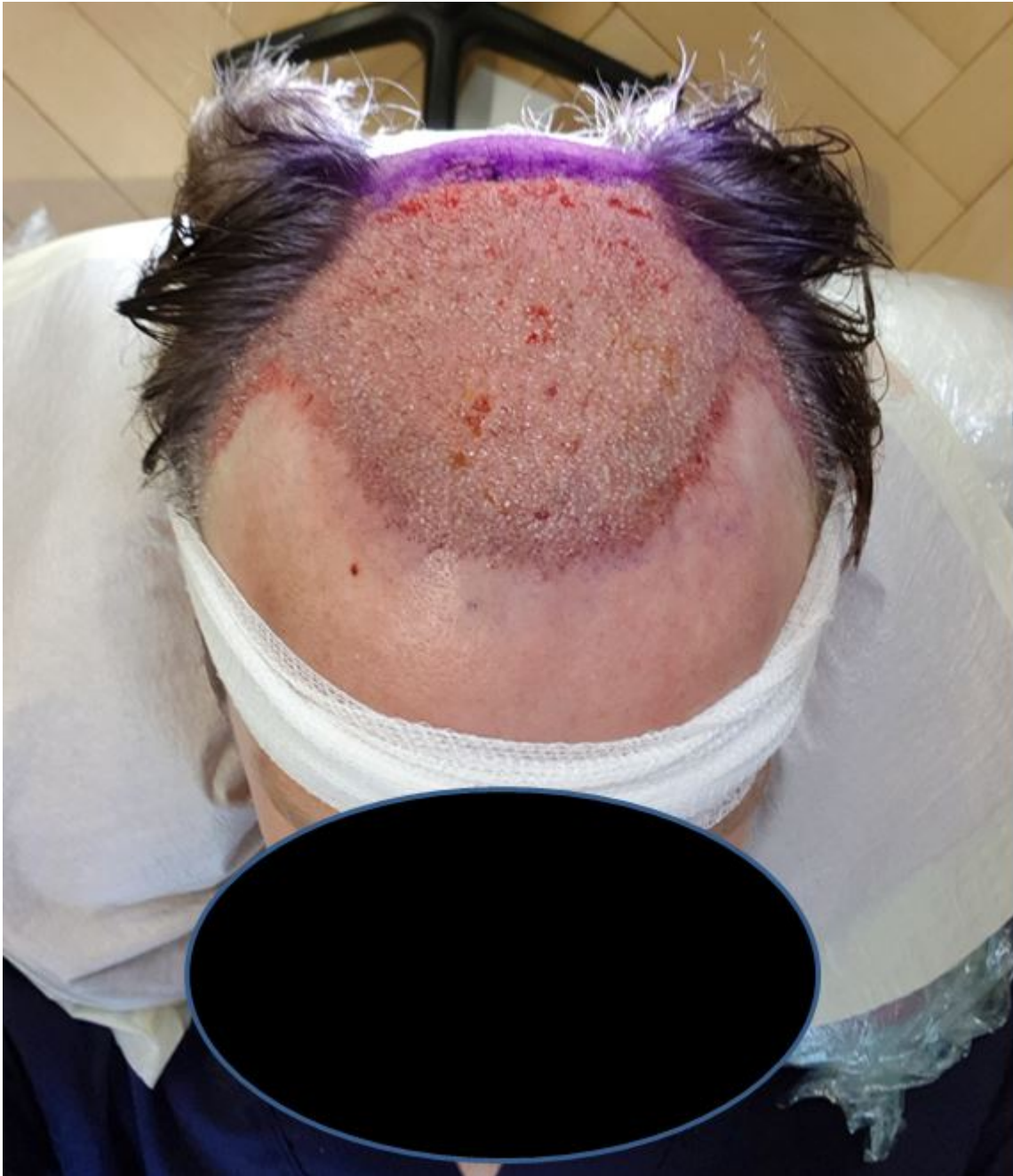
2) Day10postOP.JPG , downloaded 1556 times