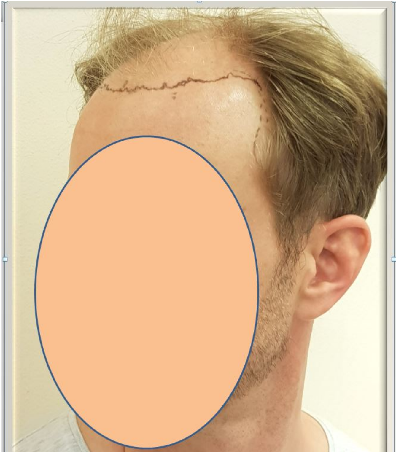
5) Scarday10postOP.JPG , downloaded 1623 times