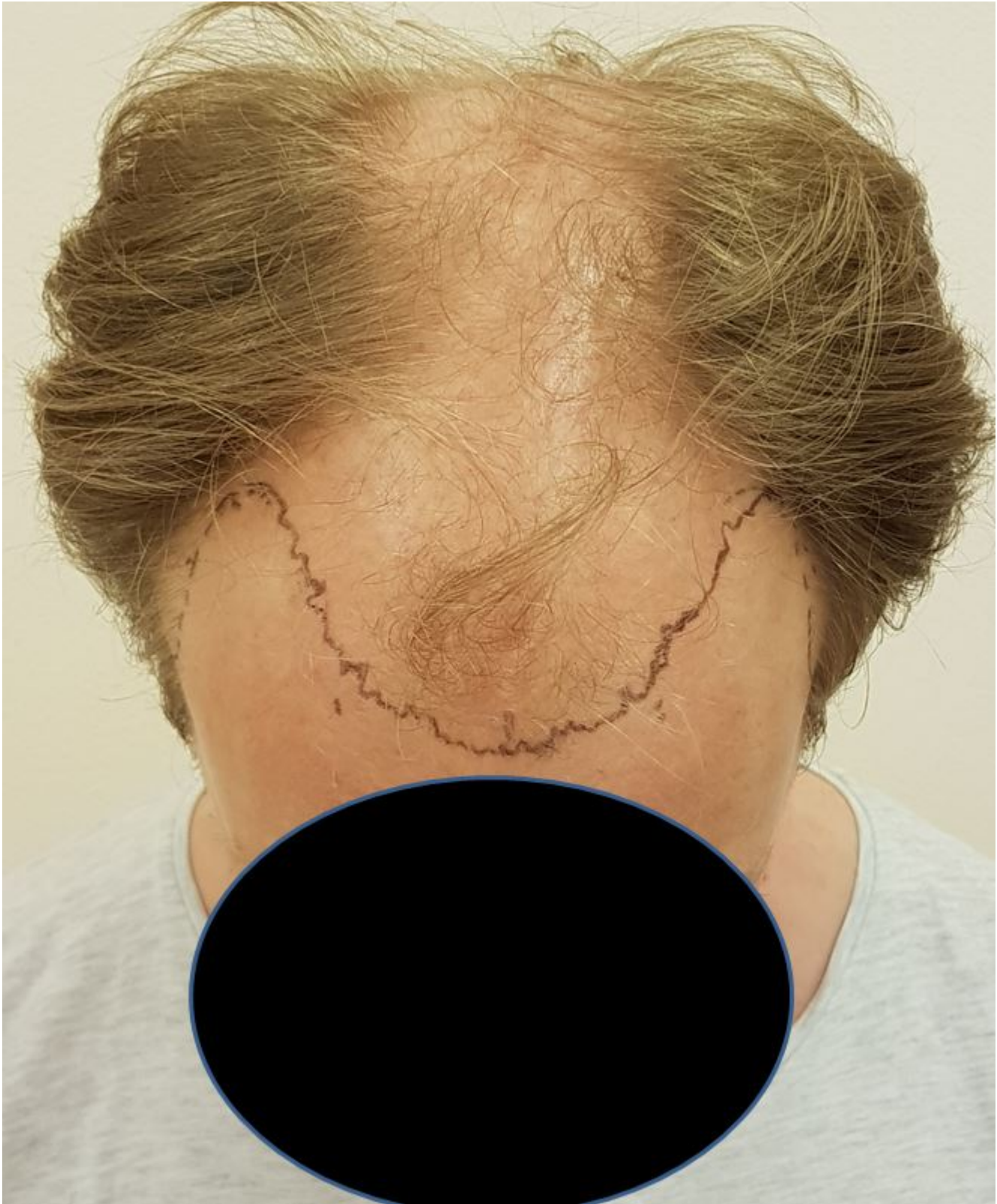
4) PreOPside.JPG , downloaded 1558 times