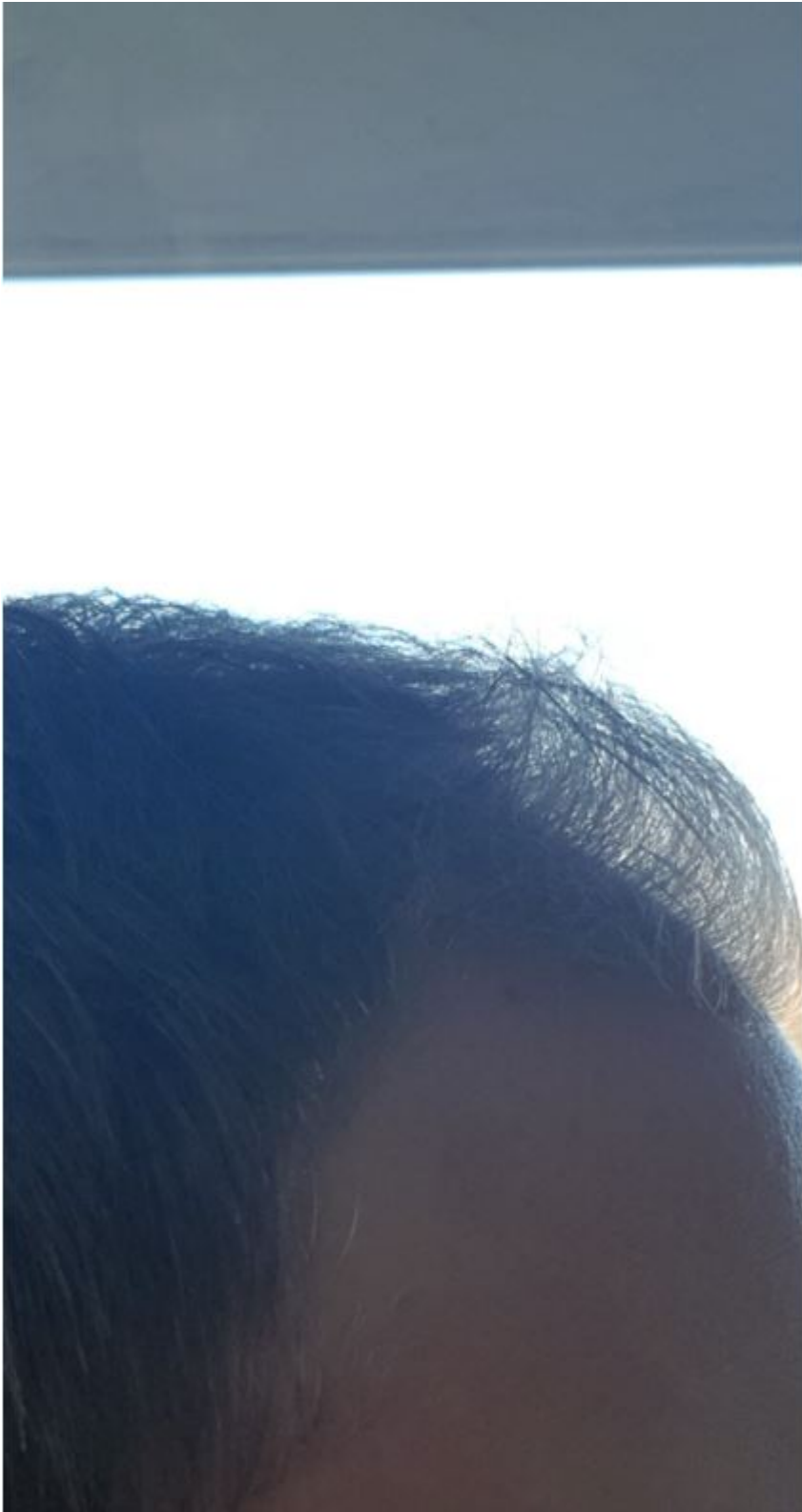
5) Verlauf 0-7.JPG , downloaded 1039 times