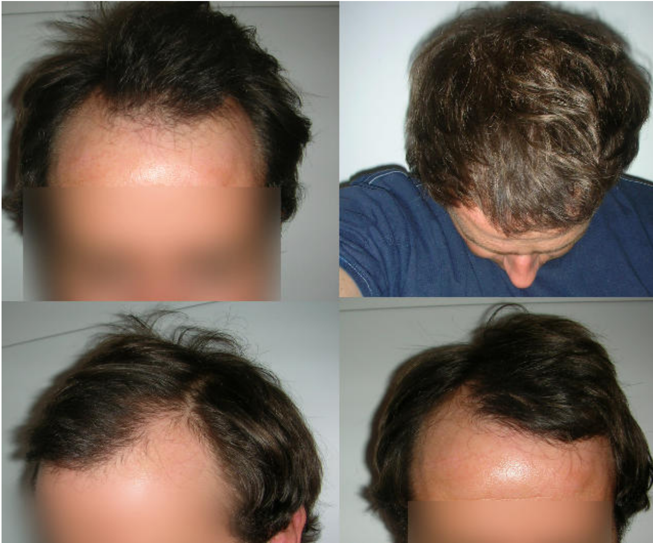
2) MöglicheHaarlinien.JPG , downloaded 380 times