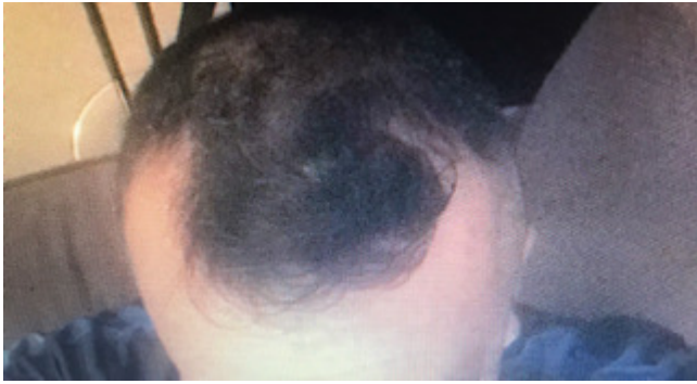
3) IMG_7450.jpg , downloaded 430 times