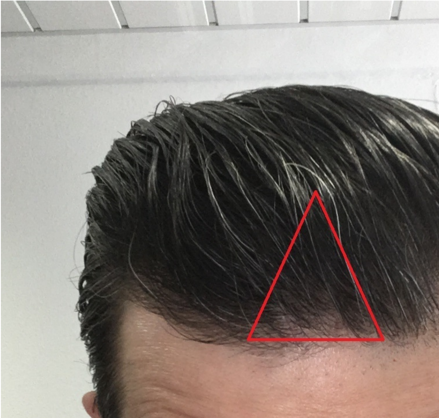
5) Front_Styled_Month11.JPG , downloaded 698 times