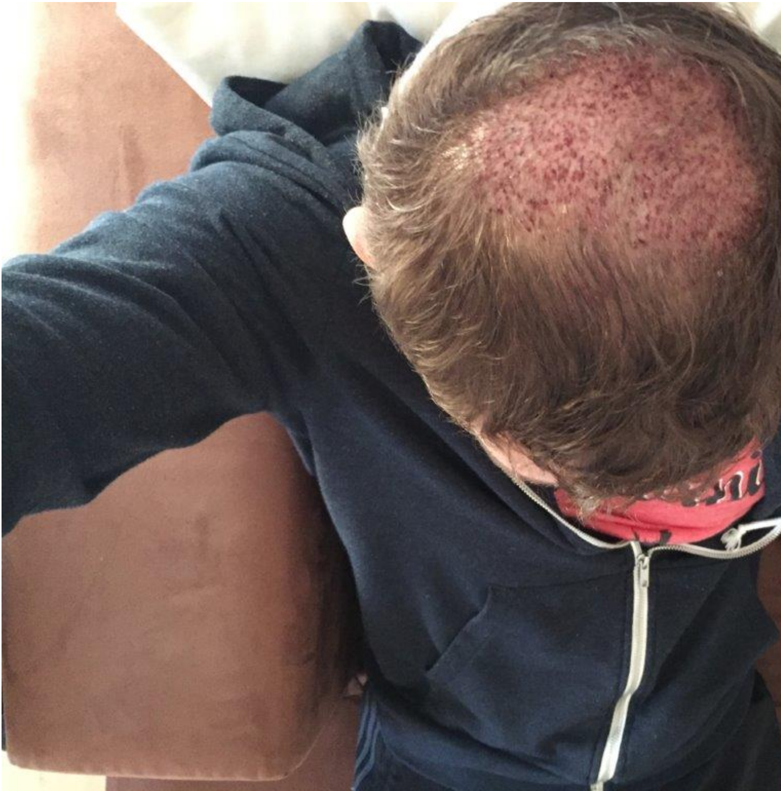
2) IMG_6028.JPG , downloaded 558 times