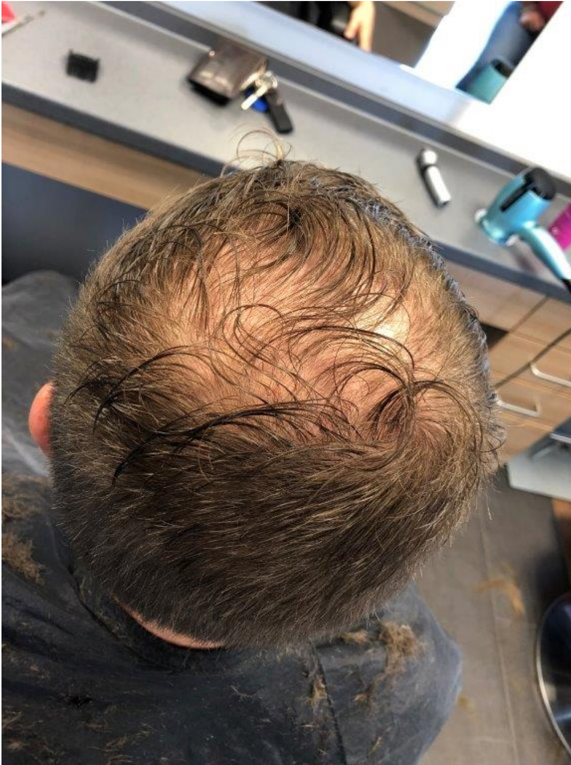
2) IMG_1153.jpg , downloaded 668 times