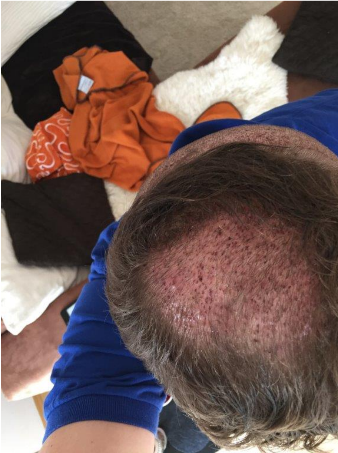
4) IMG_6067.JPG , downloaded 558 times