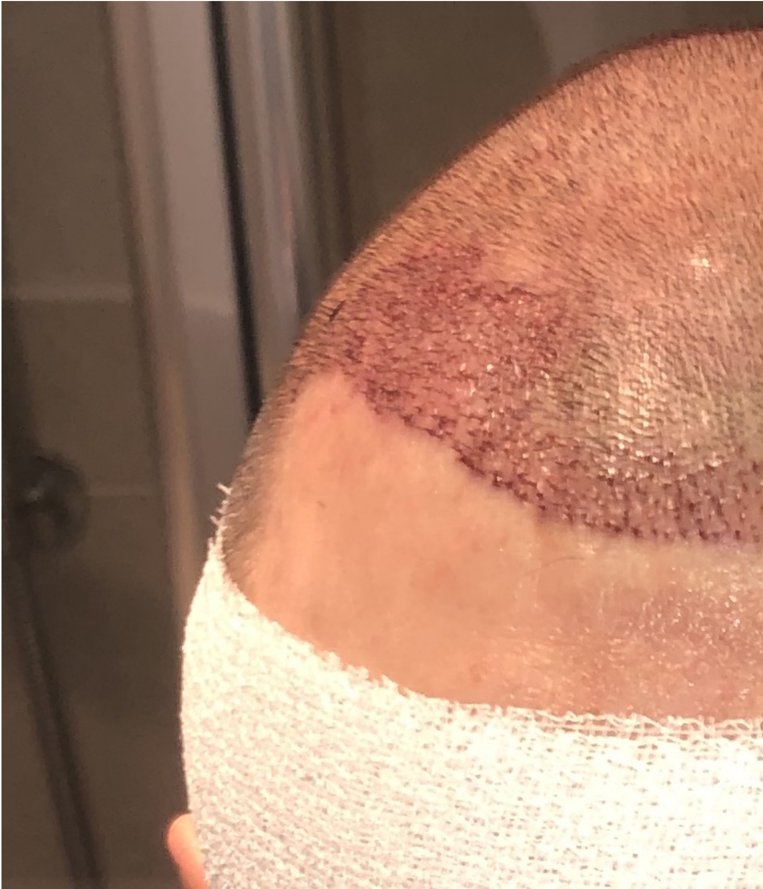
2) IMG_5802.jpg , downloaded 757 times