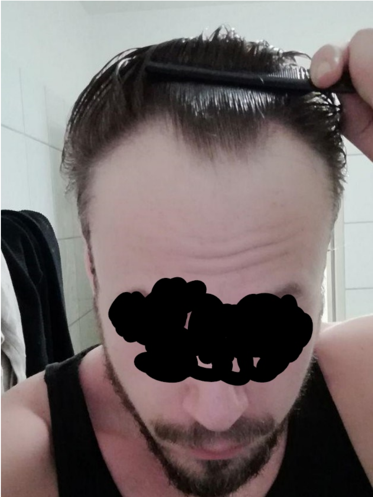
2) Inkedphoto_2018-12-05_20-21-03 (2)_LI.jpg , downloaded 275 times