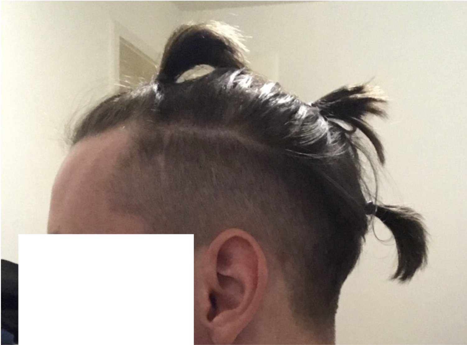
4) Vater meiner Mutter ca. 65 Jahre.jpg , downloaded 308 times