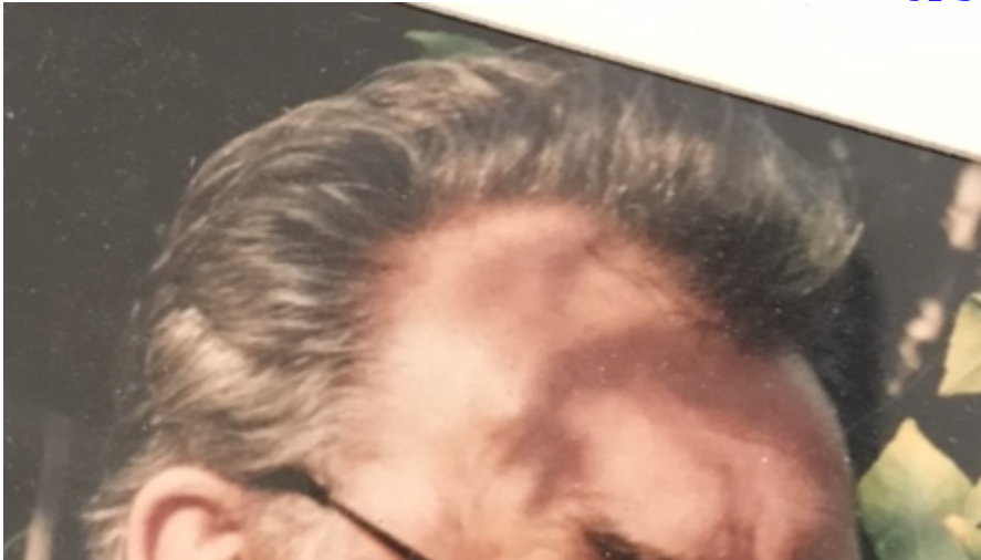
5) Ich mit ca. 15-16 Jahren.jpg , downloaded 295 times