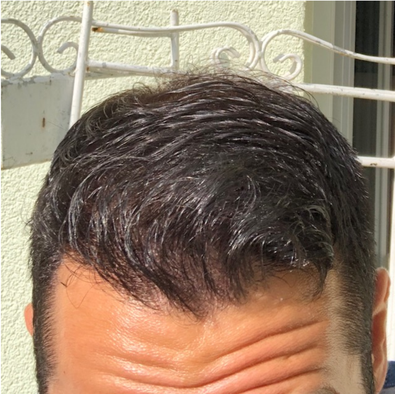
4) IMG_9410.jpg , downloaded 595 times