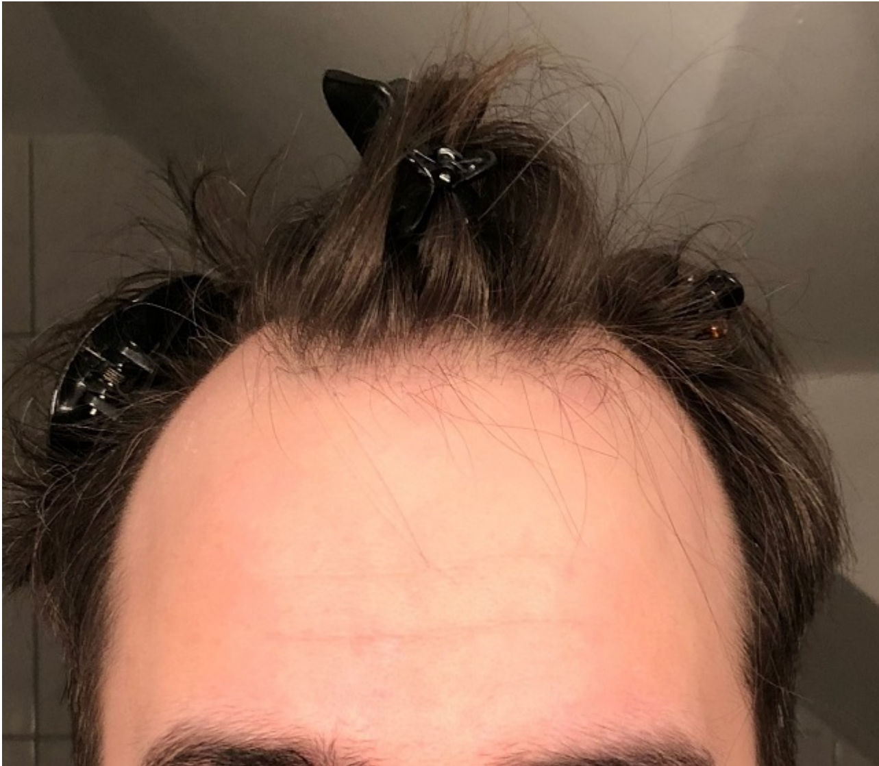
3) IMG_2110.JPG , downloaded 427 times