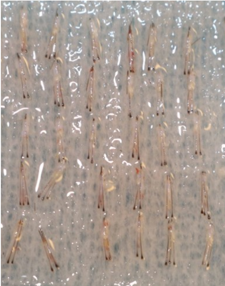
4) Schlitze für Implantate setzen.jpg , downloaded 684 times