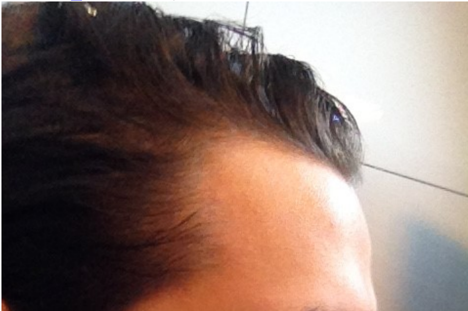
3) IMG_0022.JPG , downloaded 358 times