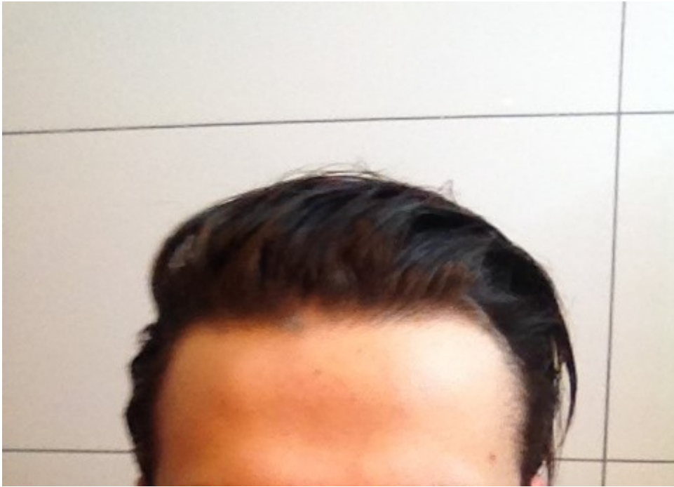
2) IMG_0028.JPG , downloaded 261 times