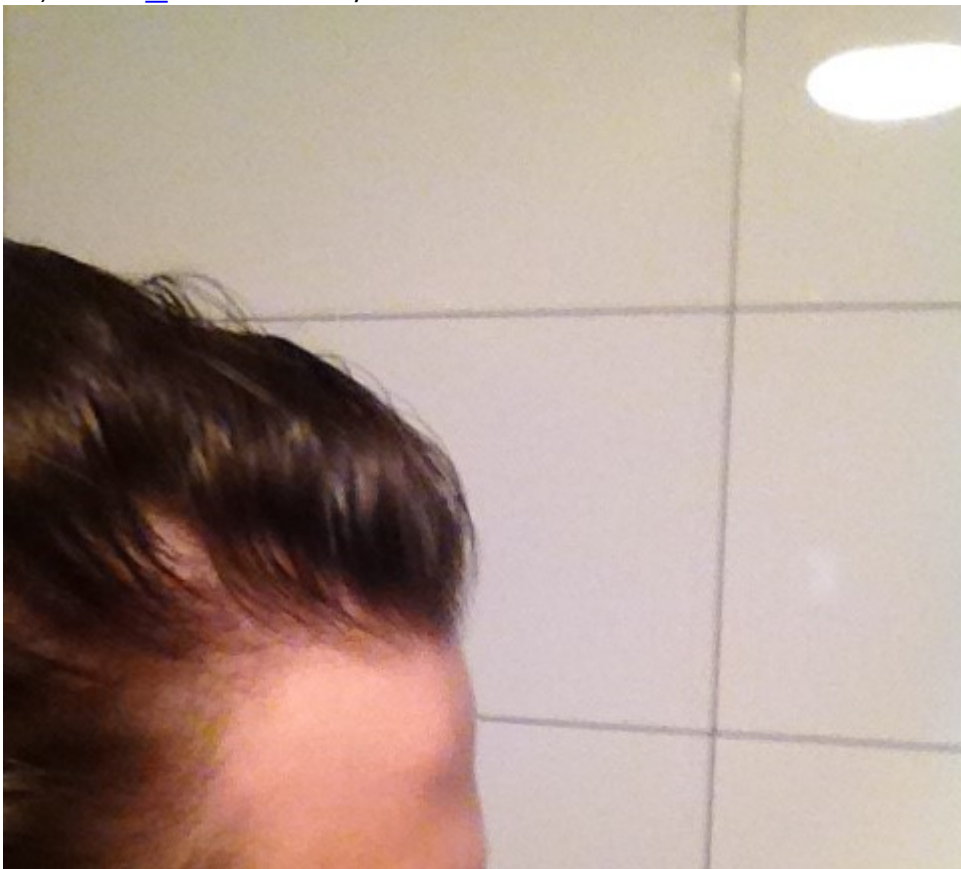
3) IMG_0027.JPG , downloaded 259 times