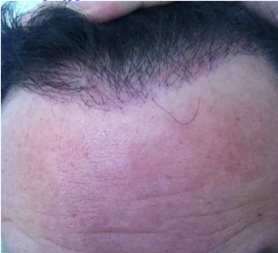
4) image.jpg , downloaded 248 times