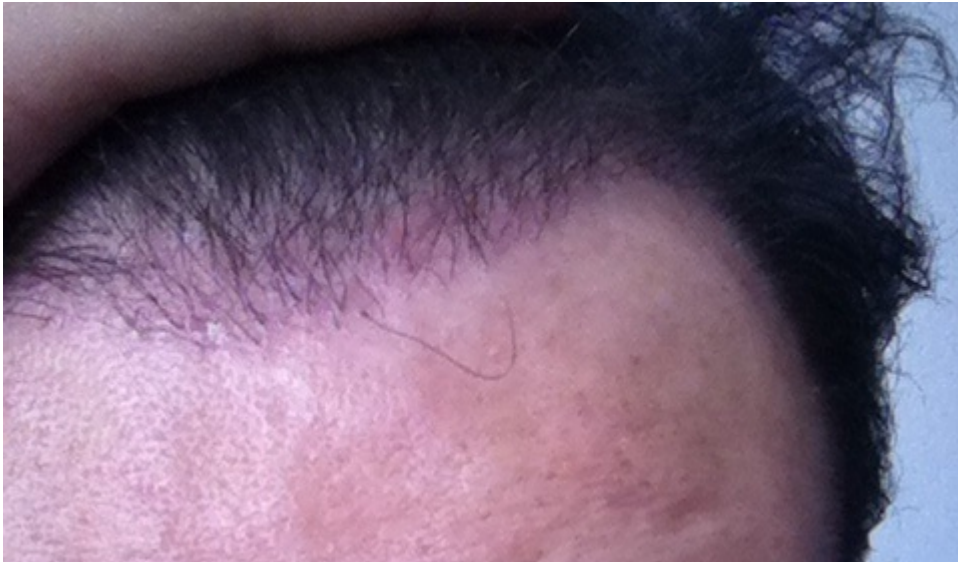
3) image.jpg , downloaded 227 times