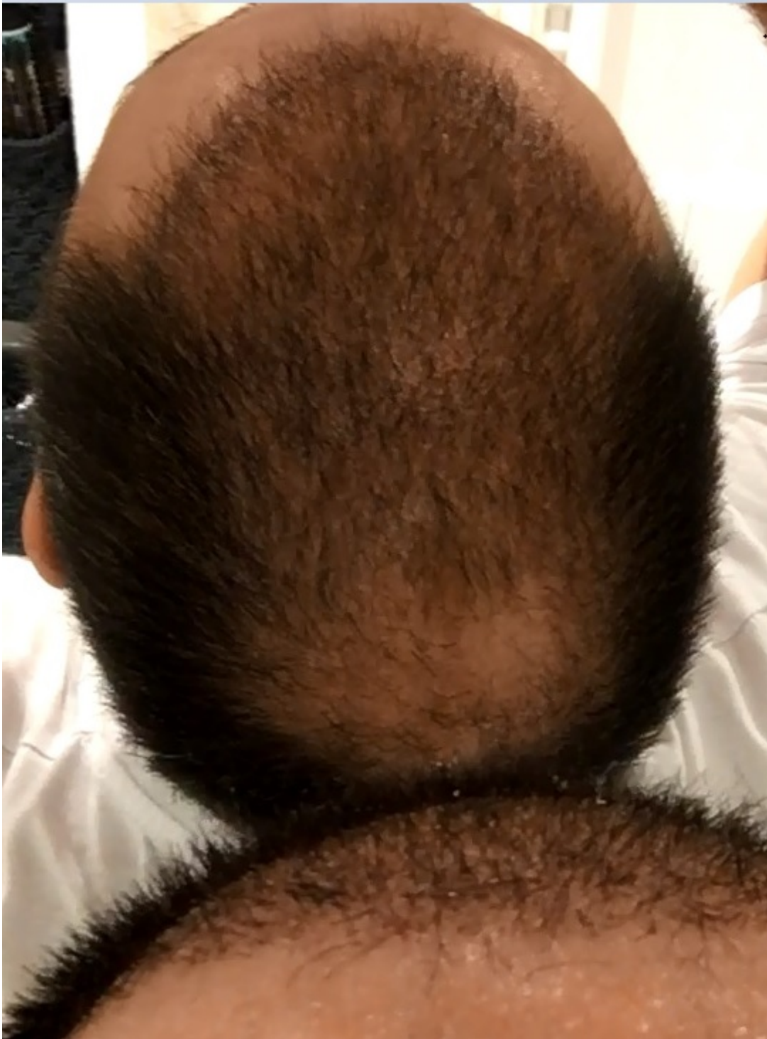
3) Bild Rückseite Woche 4.jpg , downloaded 466 times