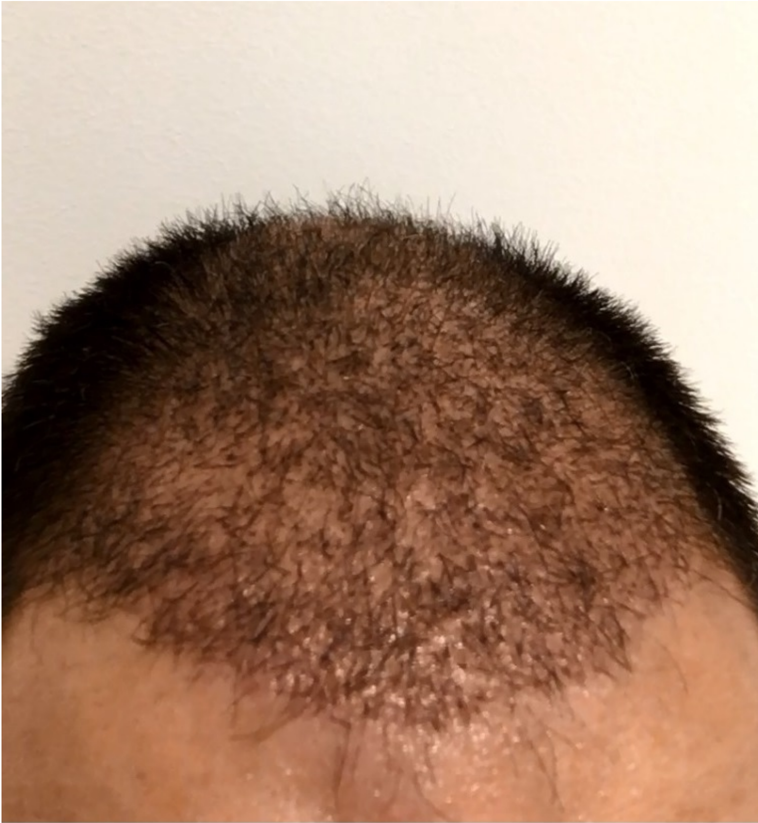
2) Bild Draufsicht Woche 4.jpg , downloaded 458 times