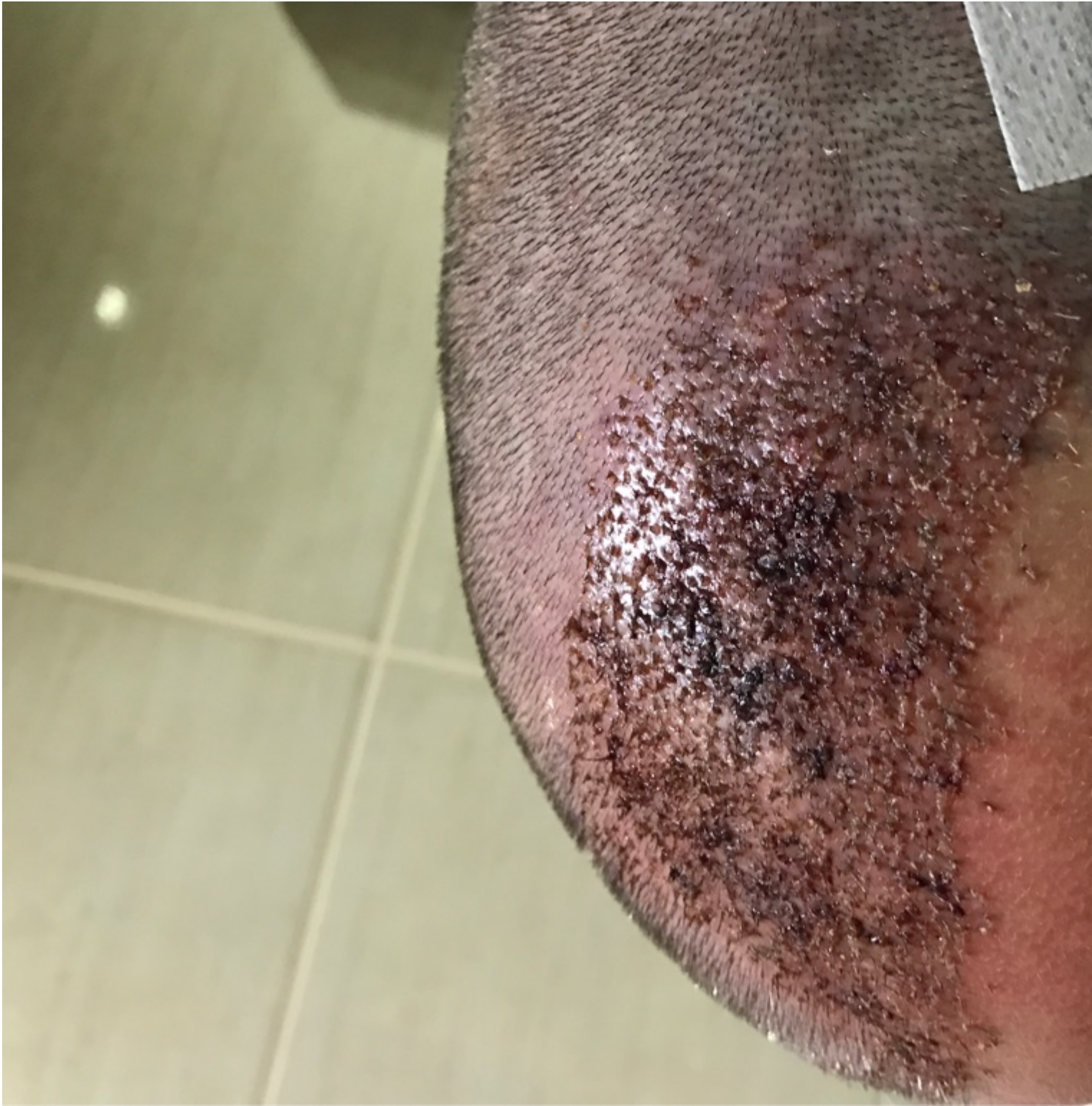
2) IMG_2255.JPG , downloaded 1752 times