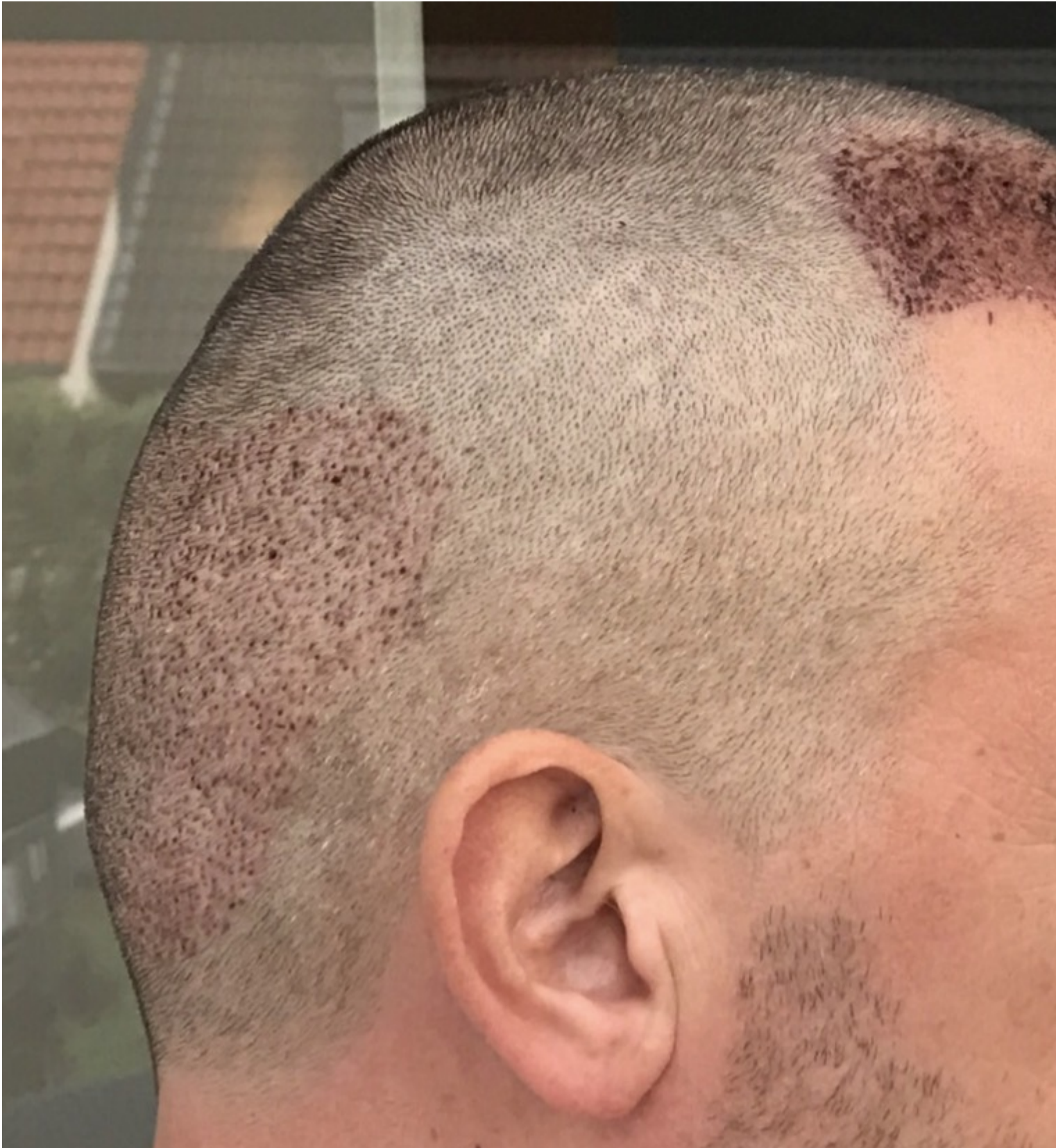
3) 2Tag_PostOP_Vorne.JPG , downloaded 1188 times