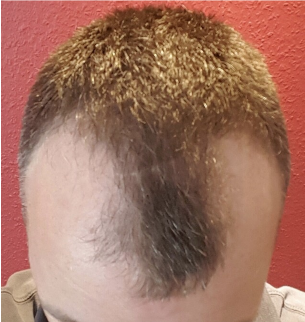
2) IMG_3946.JPG , downloaded 1186 times