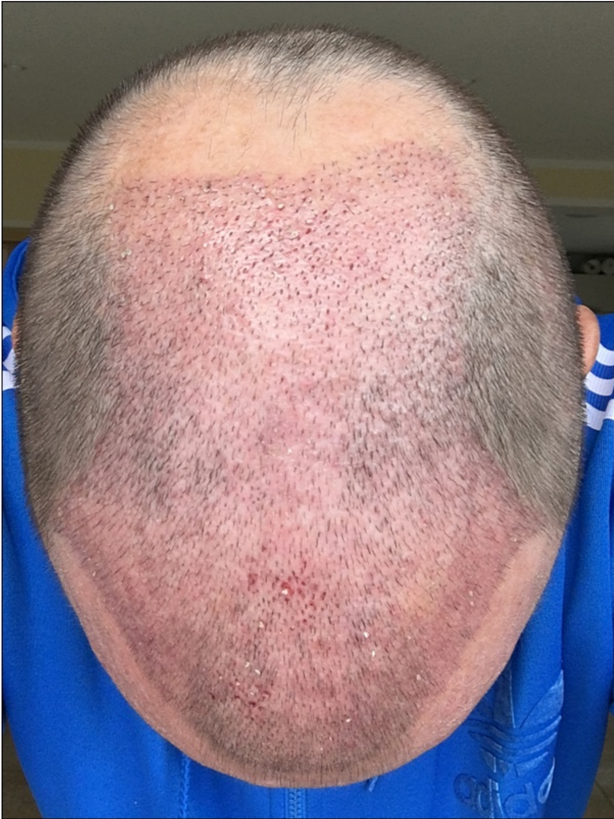
3) HT_PostOP9 - seitlich1.JPG , downloaded 226 times