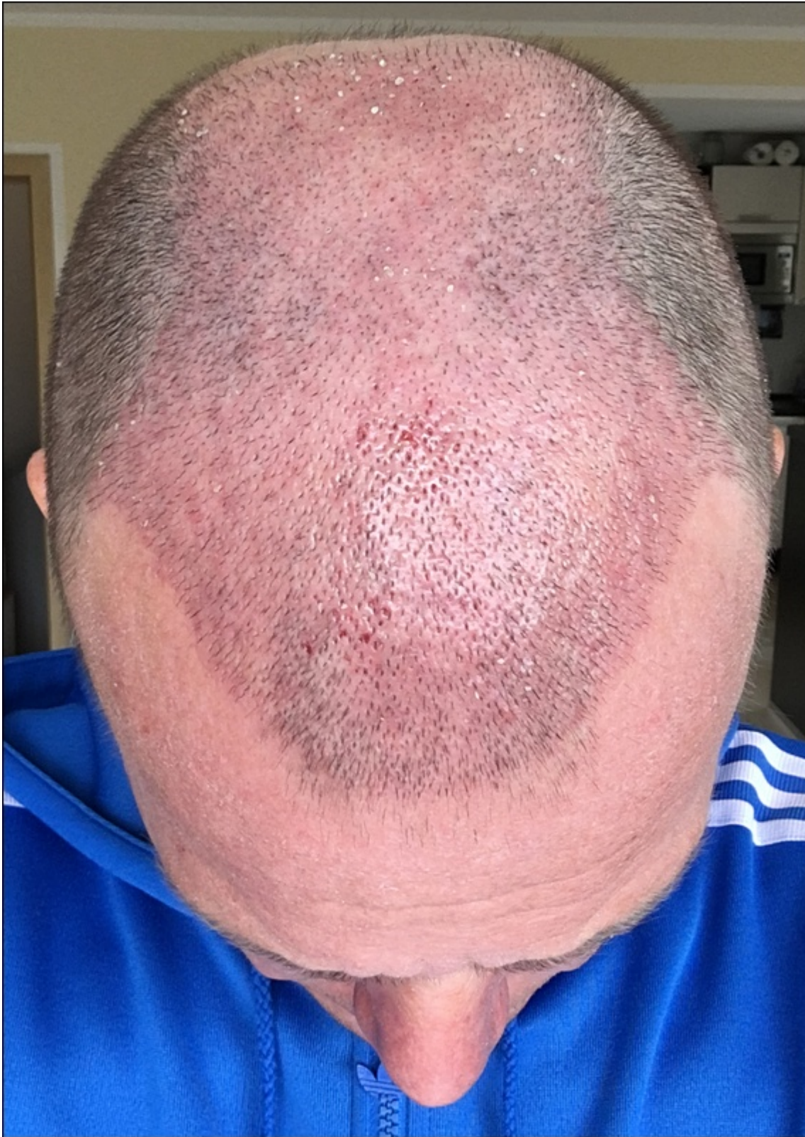
2) HT_PostOP9 - oben2.JPG , downloaded 279 times