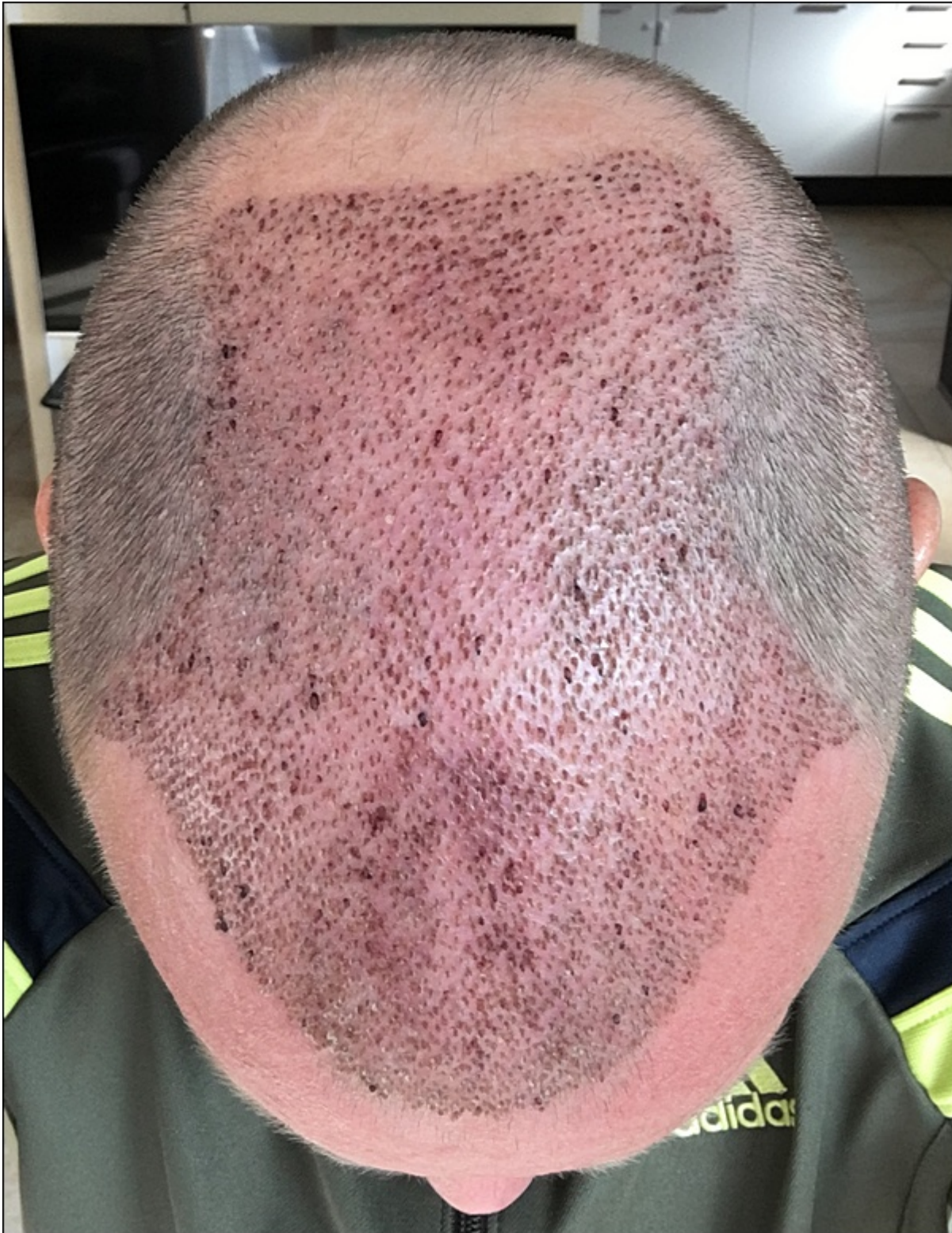
2) HT_PostOP6 - seitlich 01.JPG , downloaded 293 times