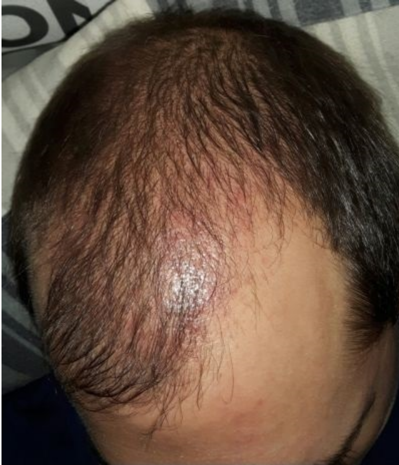
9. Wochen Post-Op