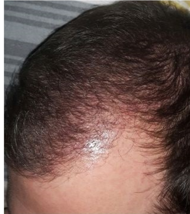
13. Wochen Post-Op

Subject: Aw: 4250 Grafts 17.08.2016 Posted by frodo on Mon, 26 Dec 2016 18:50:29 GMT View Forum Message <> Reply to Message