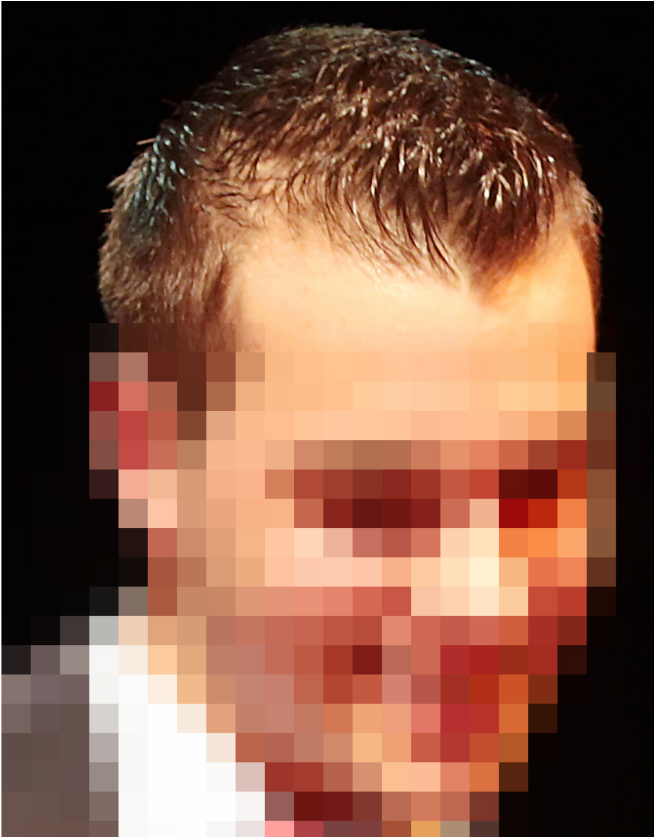
3) 2014 vorne.jpg , downloaded 575 times