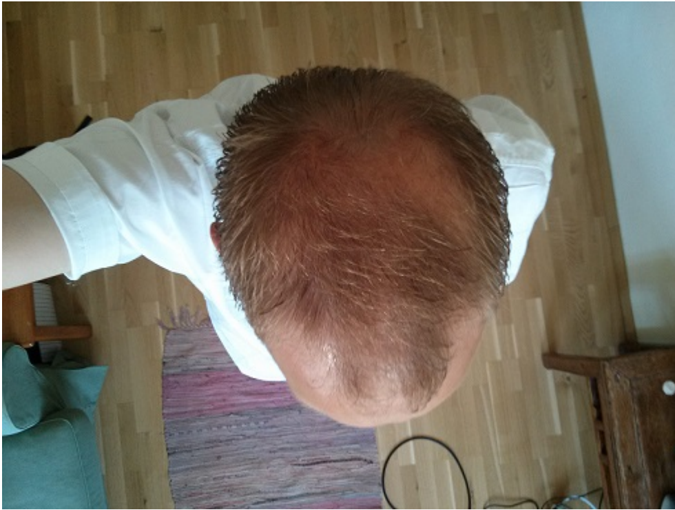
3) hinten.jpg , downloaded 893 times