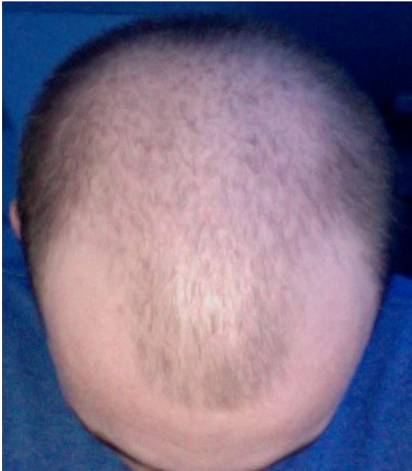
2) Bild 2.png , downloaded 674 times