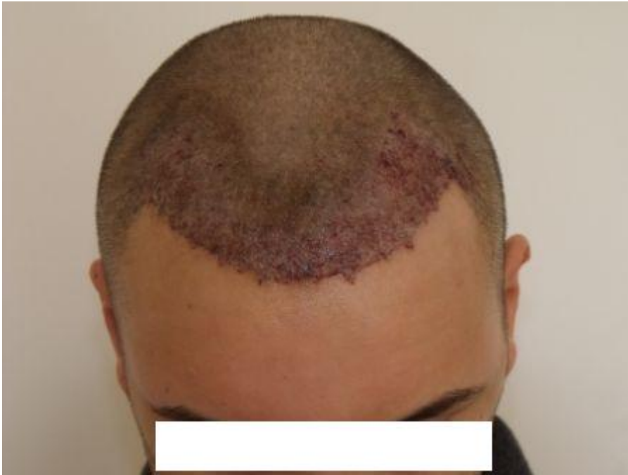
5) PreOP-5.JPG , downloaded 657 times