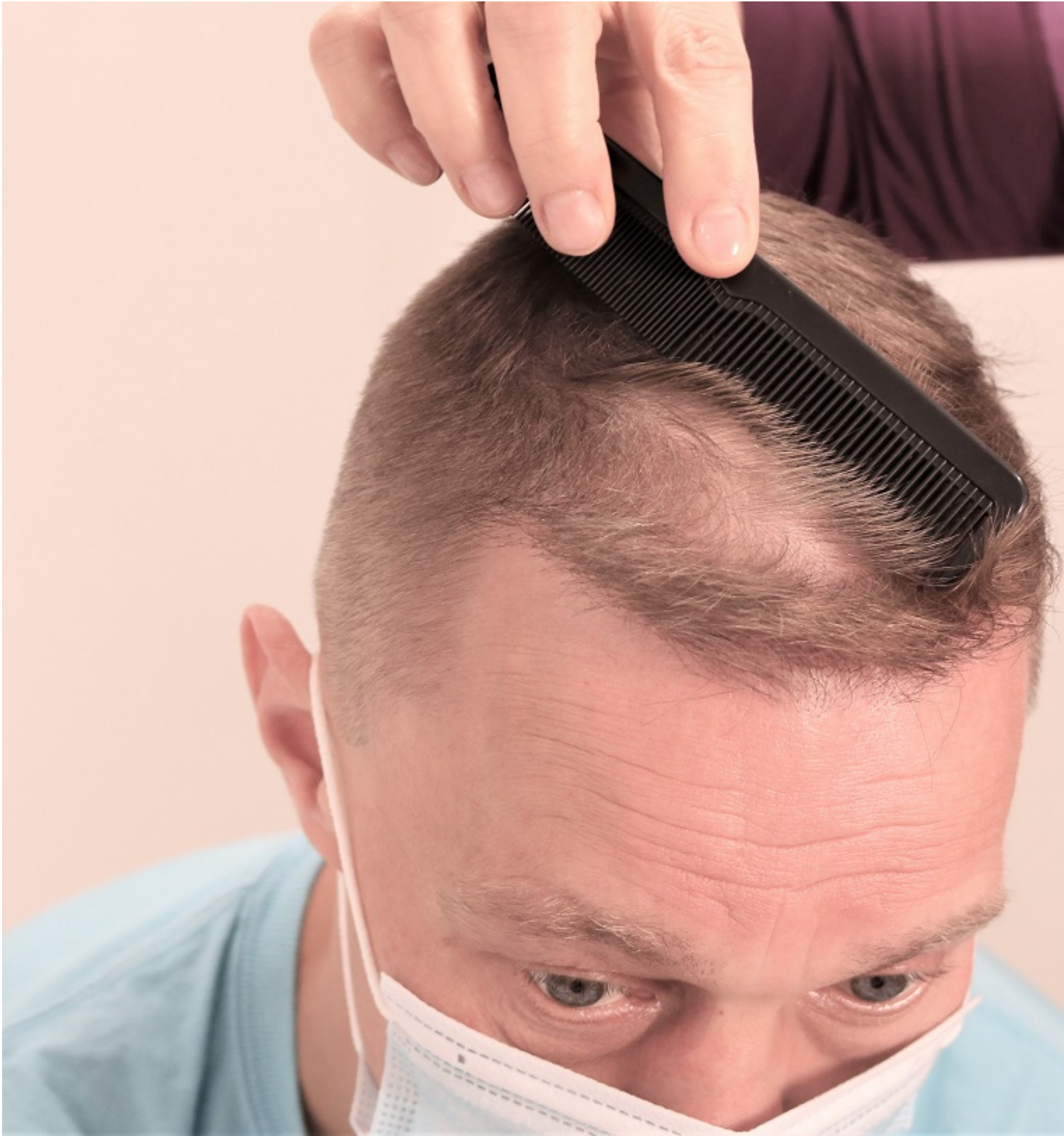
3) IMG_9135.JPG , downloaded 440 times