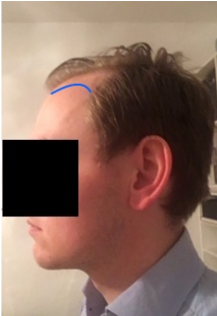
3) IMG_3222.JPG , downloaded 426 times