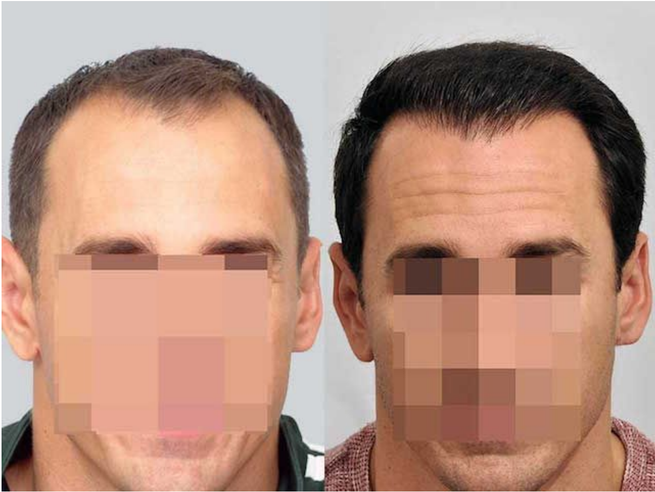
3) patient-rrw-comparison.jpg , downloaded 593 times