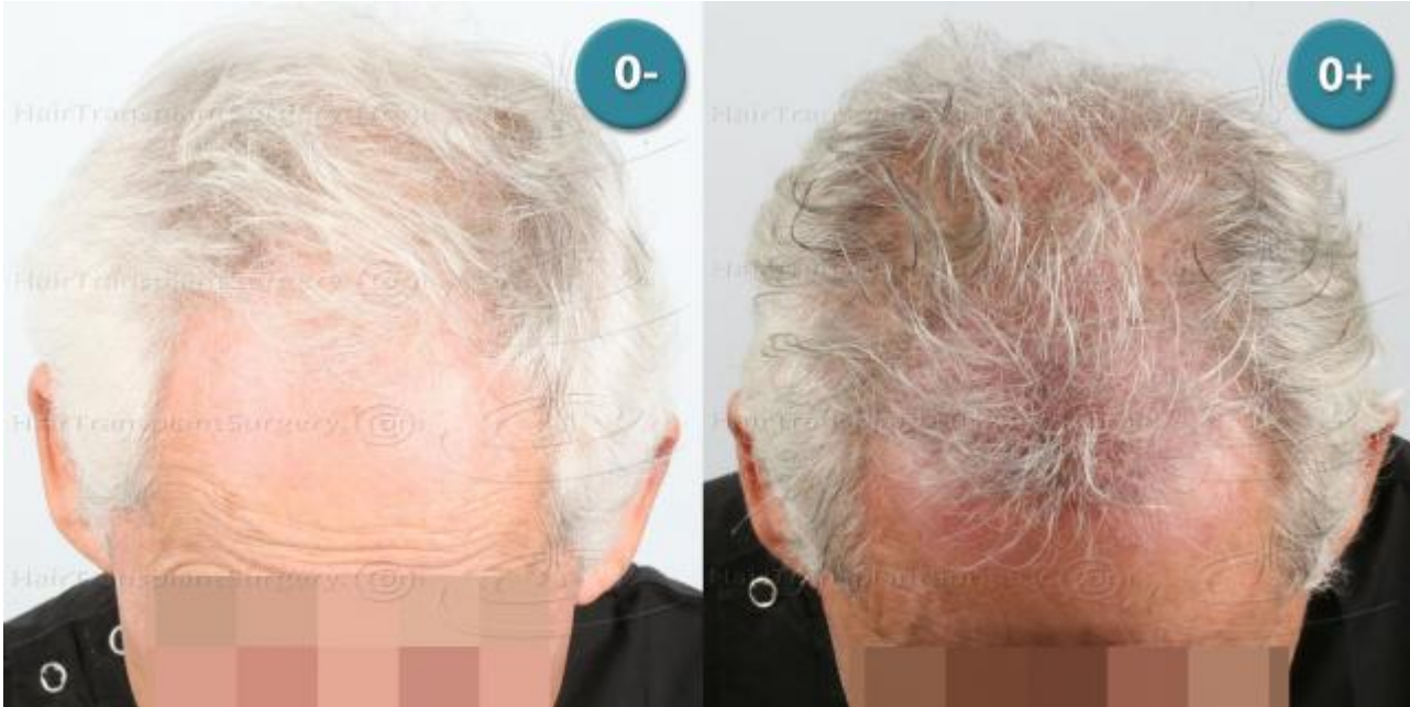
3) 115_031458_020000000.jpg , downloaded 674 times