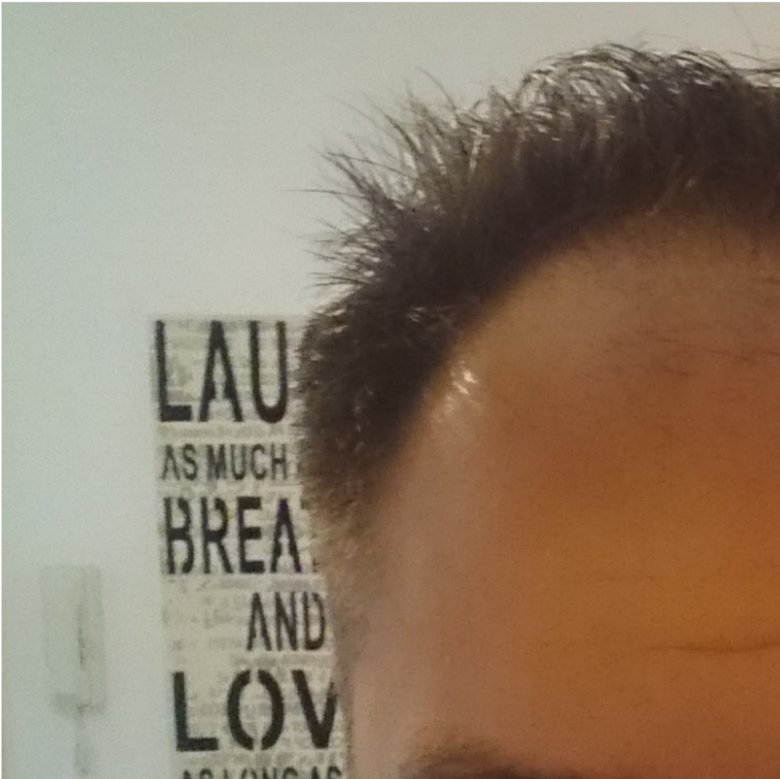
2) DSC_0693 (2).JPG , downloaded 985 times