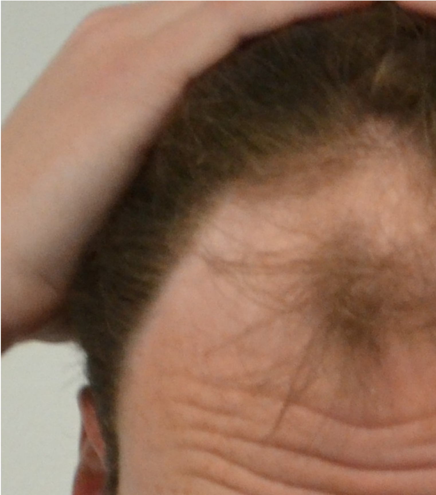
4) Post+OP-2.JPG , downloaded 402 times