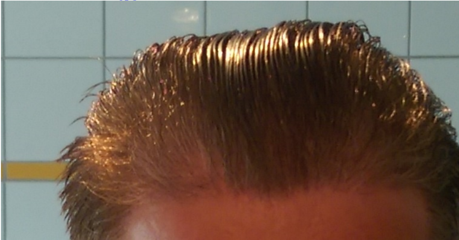
3) 21.06.15 halbtrocken.jpg , downloaded 937 times