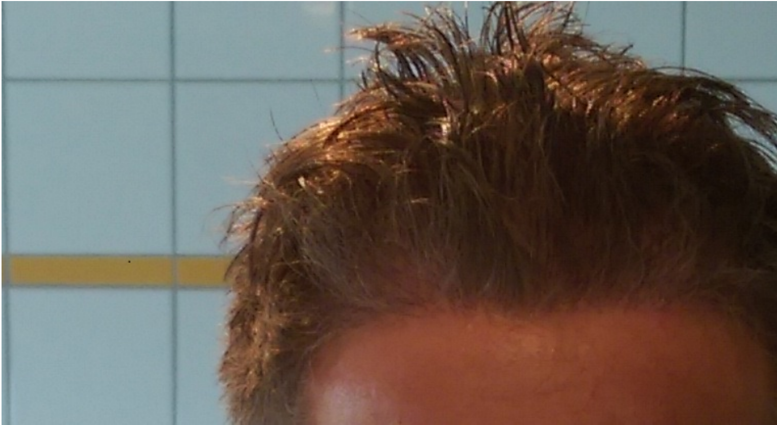
4) 21.06.15.2 trocken.jpg , downloaded 964 times