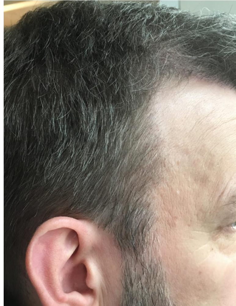
4 Monate post OP