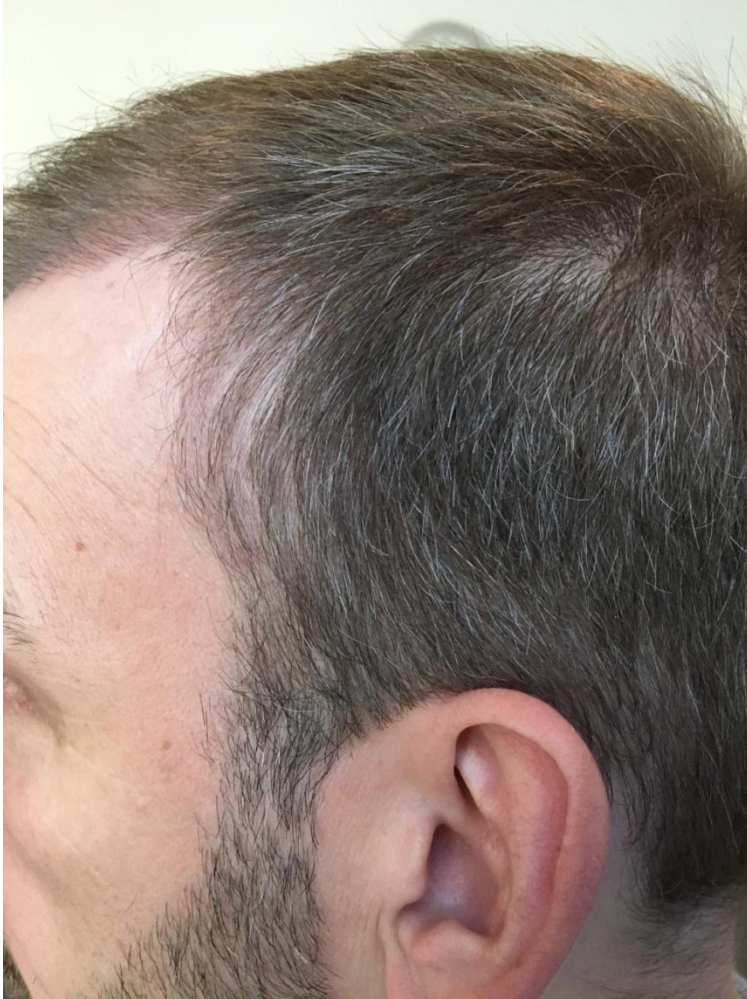
3 Monate post OP