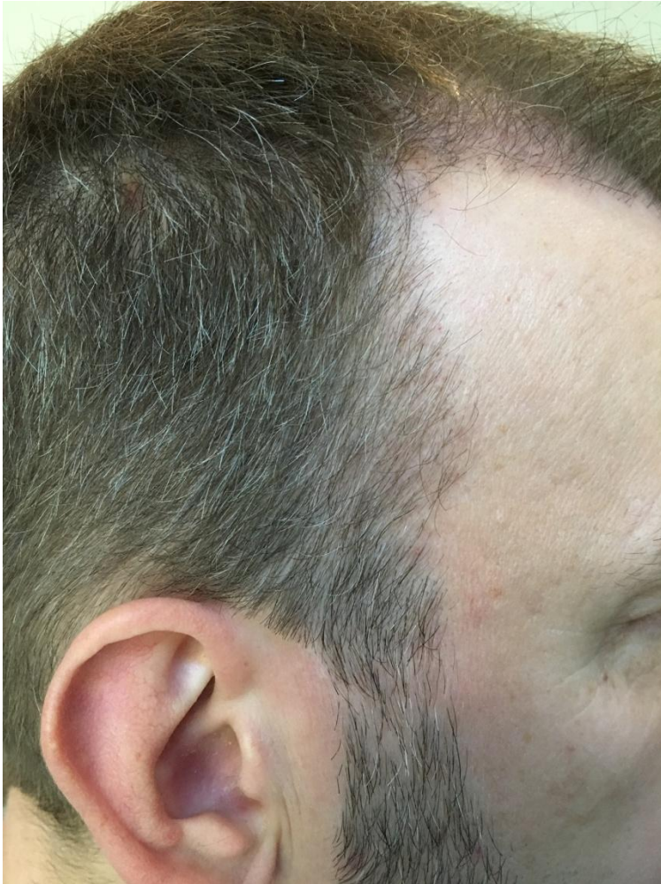
3 Monate post OP