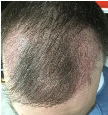
2 Monate post OP