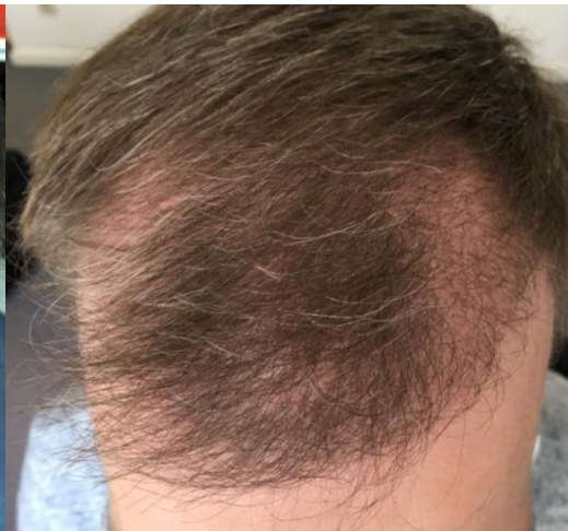
3 Monate post OP