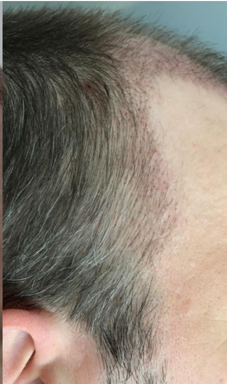
1 Monat post OP