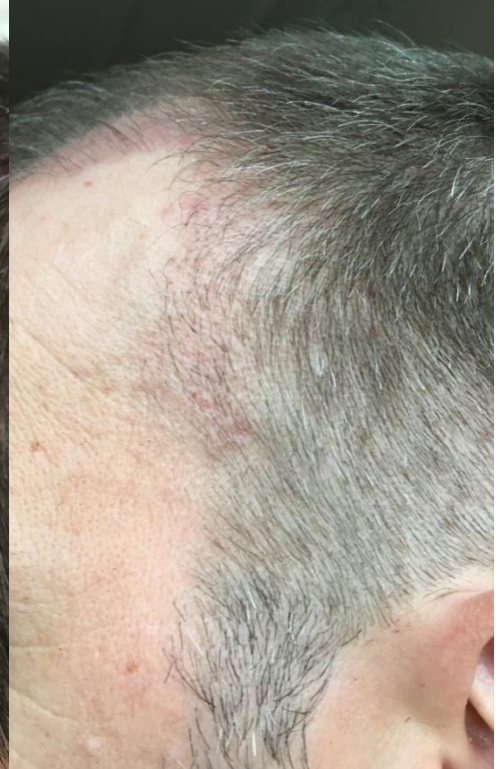
2 Monate post OP