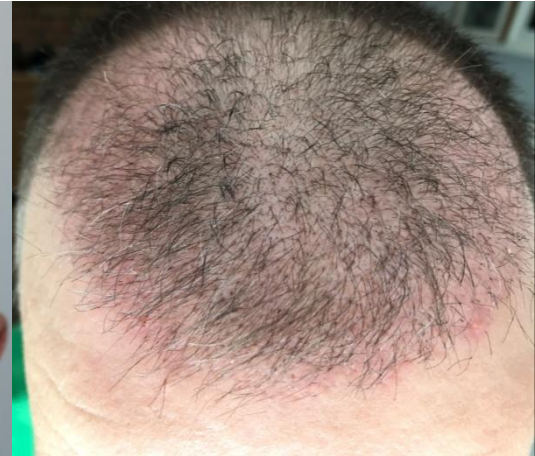
1 Monat post OP