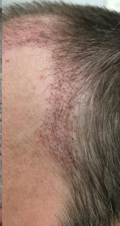
1 Monat post OP