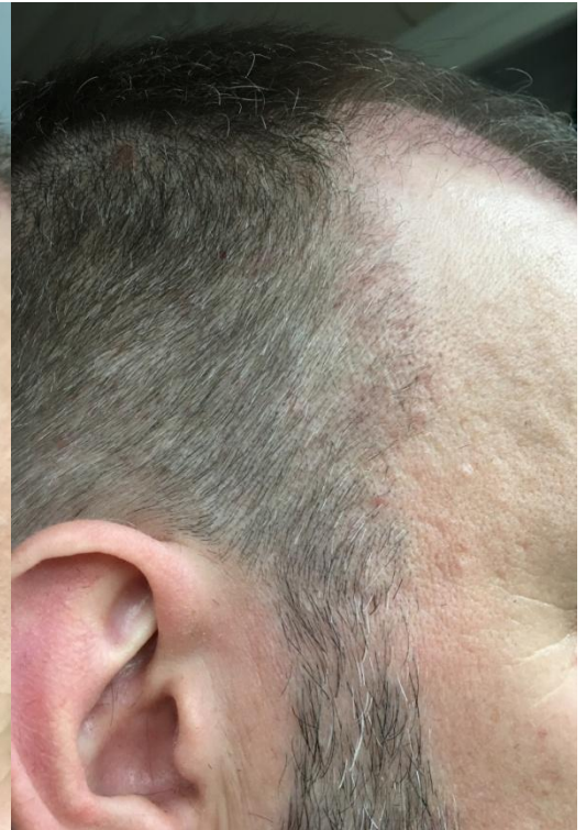
2 Monate post OP