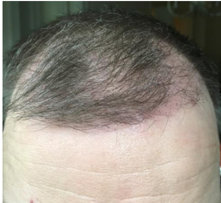
2 Monate post OP