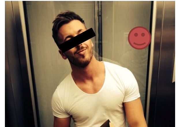
Scheitel durch transplantierten Bereich gezogen