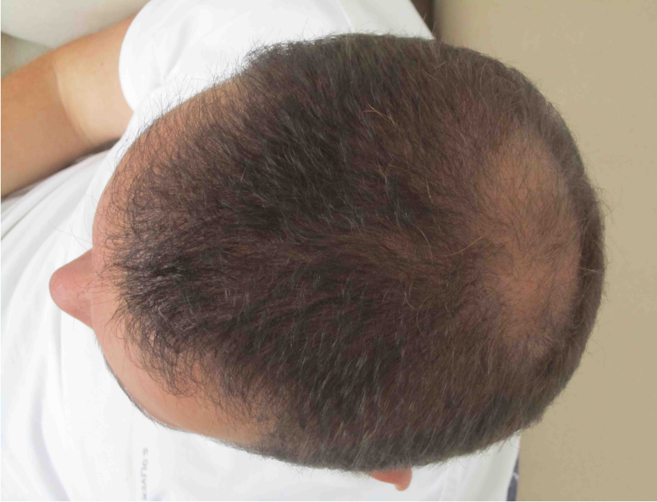
Donor Monat 7 OP: