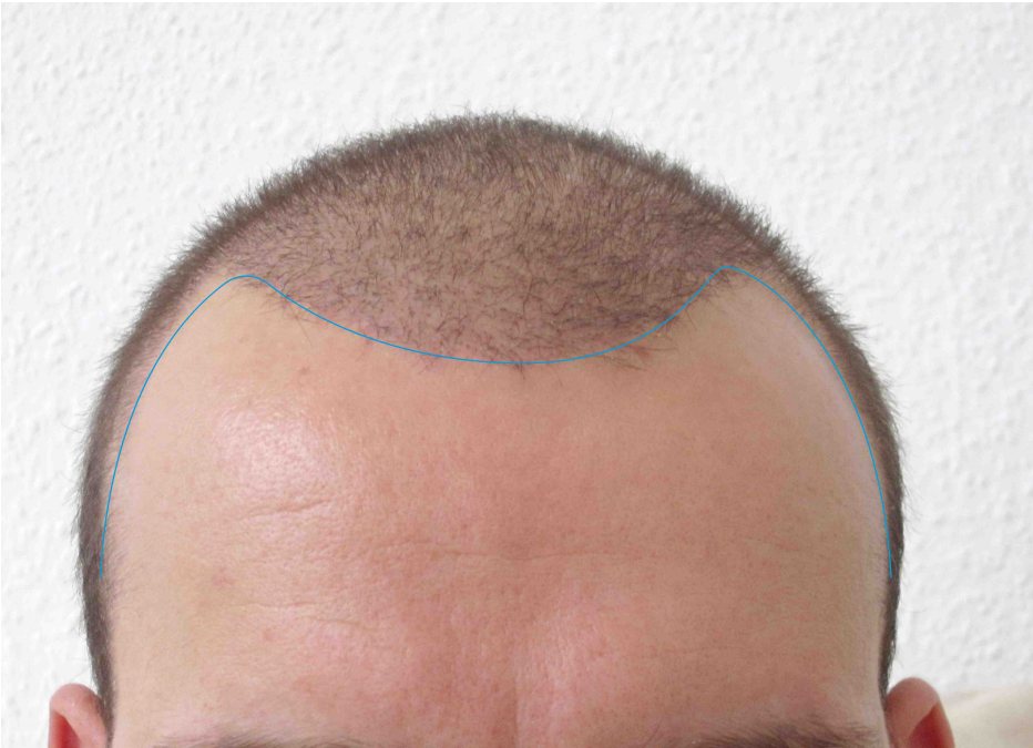
Monat 7 Post OP