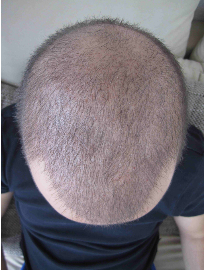
Donor Monat 1 OP: